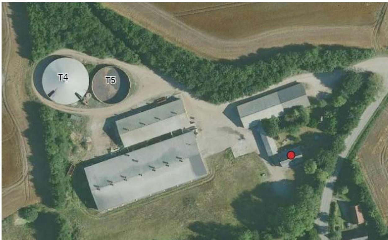
Figur 1. Oversigtskort over Frørupvej 45.

Der er to gyllebeholdere på ejendommen, og den største af disse er allerede overdækket med telt. Der er nu et ønske om at etablere en fast overdækning på den mindste gyllebeholder på ejendommen. Beholderen på 1.800 m 3 fra 1998 (T5 jf. BBR) er placeret i tilknytning til eksisterende bygningsmasse på ejendommen (jf. figur 1).