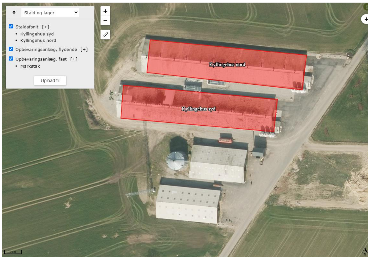
Figur 1. Oversigtskort over produktionsarealet på Vojumvej 7.

IE-husdyrbruget på Vojumvej 7, 6070 Christiansfeld påbydes i henhold til § 39, jævnfør § 41 og § 43 a i husdyrbrugetloven nedenstående vilkårsændringer i forhold til miljøgodkendelsen fra 2009 med tilhørende revurdering (2017).