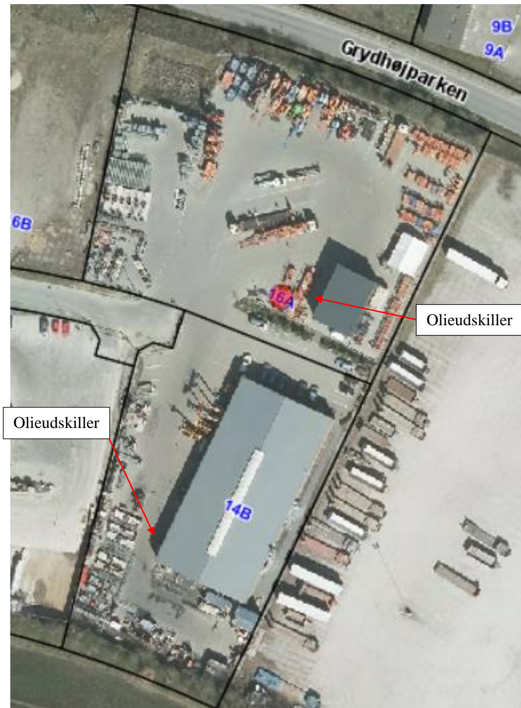
Luftfoto af virksomheden med matrikelskel, anno 2019