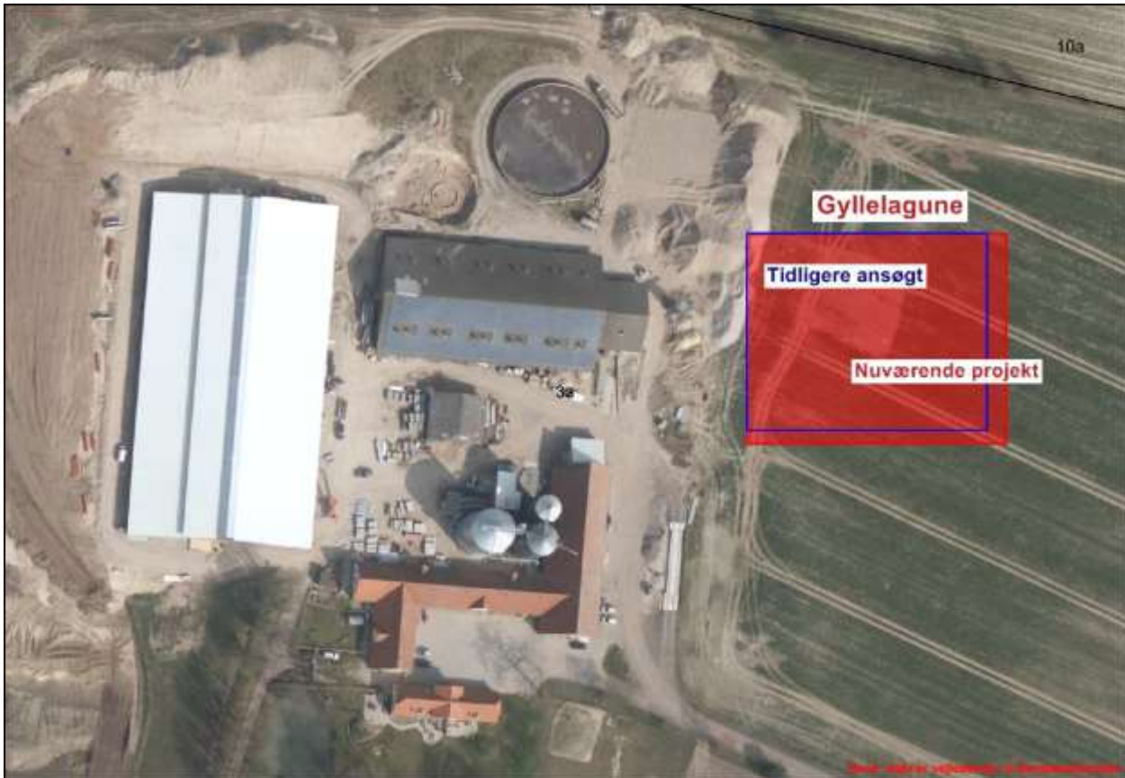
Anlægstegning: Blå markerer den tidligere projektering af lagunen, rød markerer den ansøgte.

Der er tidligere indsendt dokumentation fra firmaet bq millaq for, at etablering af gyllelagunen sker i henhold til byggeblad 103.04-30. Det er Kommunens vurdering, at når det er samme projekt, bare på 10.000 m 3 , er denne dækkende.