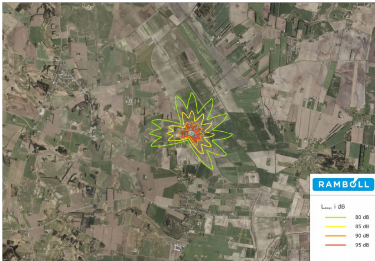
Modelberegnet maksimalværdi ved flyvning med den lille akutlægehelikopter.