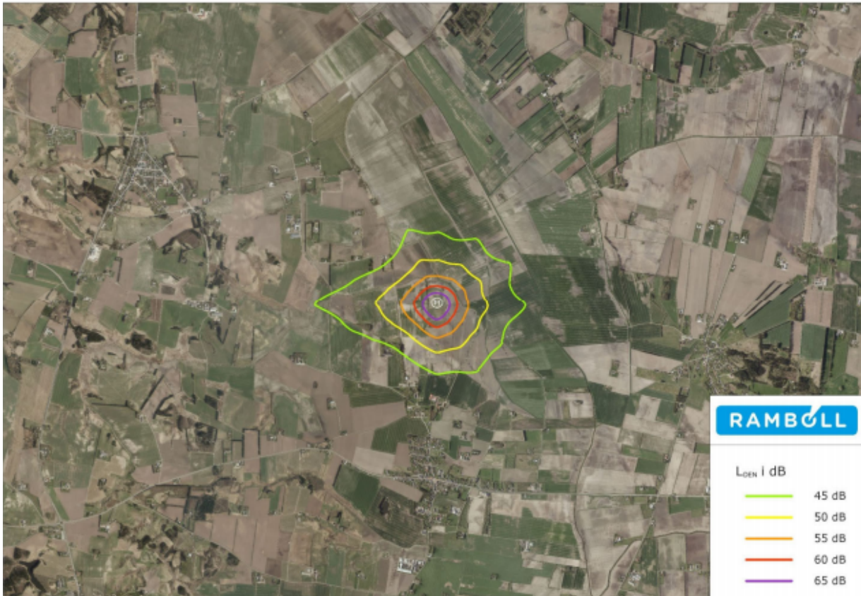
Modelberegnet døgnmiddelværdi ved flyvning med den lille akutlægehelikopter.