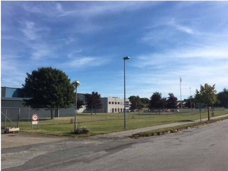
Figur 2. Billede af virksomheden set fra Holmagervej.

Virksomheden oplyste, at der ikke havde været unormal drift eller aktiviteter på virksomheden, som kunne give anledning til lugtgener udenfor virksomhedens område.