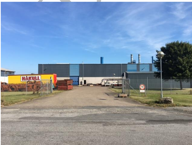
Figur 3. Billede af virksomheden set fra Holmagervej.