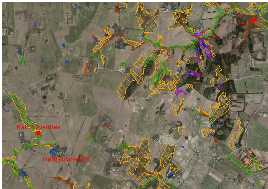
FIGUR 1 BELIGGENHED AF NÆRMESTE §3-NATUR SAMT NATURA 2000. DESUDEN PUNKTER, HVORTIL DER ER BEREGNET AMMONIAKDEPOSITION

Kommunen har foretaget en vurdering af naturområderne i området omkring husdyrbruget og lavet beregninger af totaldepositionen til relevante naturområder. Nedenstående figur viser beliggenheden af beskyttet natur omkring husdyrbruget. Beregning af totaldeposition til de relevante naturområder fremgår af den efterfølgende tabel.