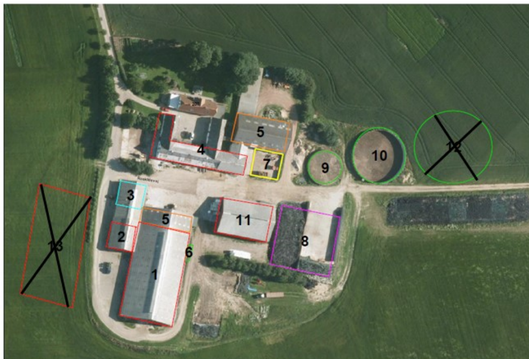
Figur 4. De to ansøgte anlæg nr. 12 og 13, markeret med et kryds, er ikke etableret.