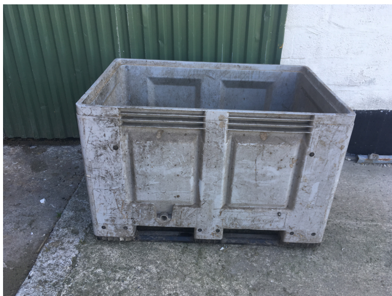
Figur nr. 3. Gødningstank.

Der er ikke en møddingsplads på ejendommen. Gødning fra chinchillaerne samles i containere/kar med fast bund og uden afløb, hvor det opbevares i minimum 3 måneder før udbringning. Tankene er på ca. 100 x 60 x 60 cm, se nedenstående figur. Ejendommen har 6 tanke.