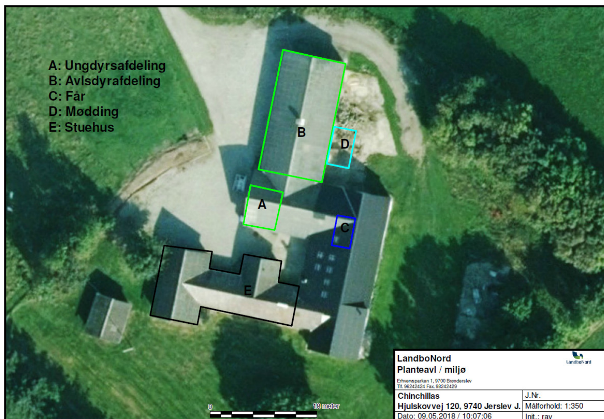
Figur nr. 1. Anlægstegning.

Afstandskrav og faktiske afstande jf. husdyrbruglovens § 6 og § 8: