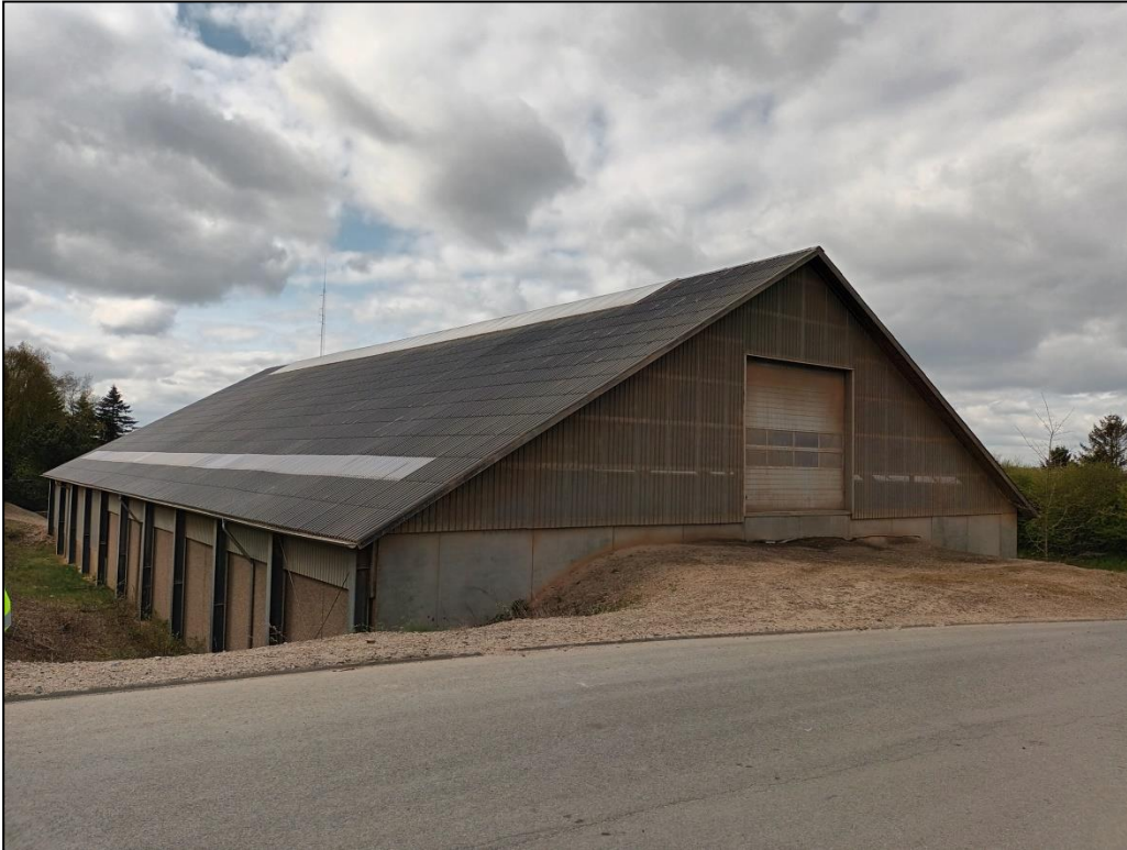
Foto nr. 1. Fotoet viser tilkørslen til den nordlige side af hallen.