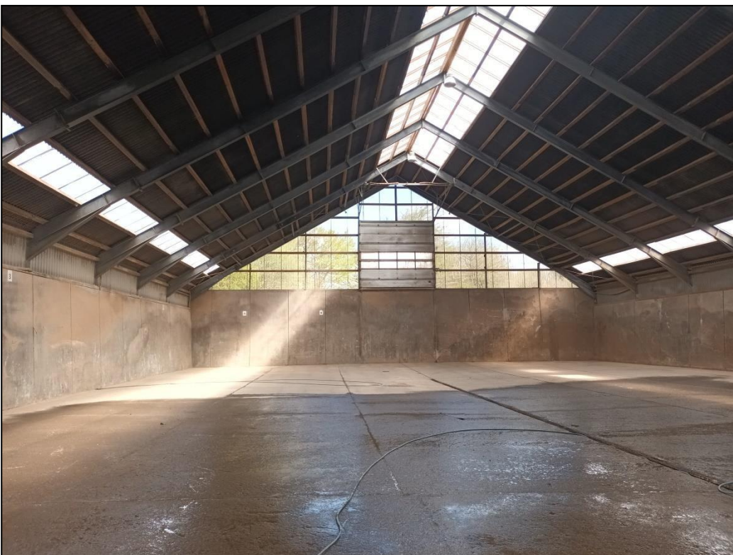
Foto nr. 2. Fotoet viser området i den nordlige del af hallen hvor madaffaldet vil blive opbevaret i containere.