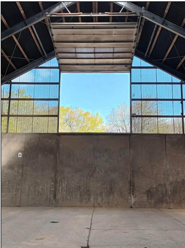
Foto nr. 3. Fotoet viser af tipningsstedet med åben port

Madaffaldet vil være kildesorteret affald fra husholdninger og institutioner/virksomheder i HaderslevKommune.