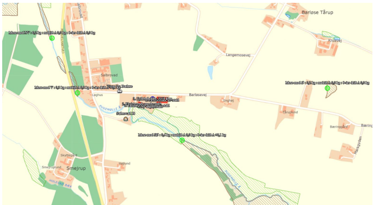
Figur 4: Placering af staldanlægget på Barløsevej 2 i forhold til de nærmeste kategori 3-naturområder, samt § 3 beskyttet natur (fra husdyrgodkendelse.dk).

Enge og søer er ikke omfattet af definitionen på kategori 3-natur, men når de er beskyttet af naturbeskyttelsesloven § 3, gælder det, at der ikke må ske en tilstandsændring, og kommunen er i forbindelse med behandling af en ansøgning om godkendelse/tilladelse til husdyrbrug forpligtiget til, at vurdere om der er risiko for tilstandsændring i de omkringliggende § 3 naturbeskyttede områder.