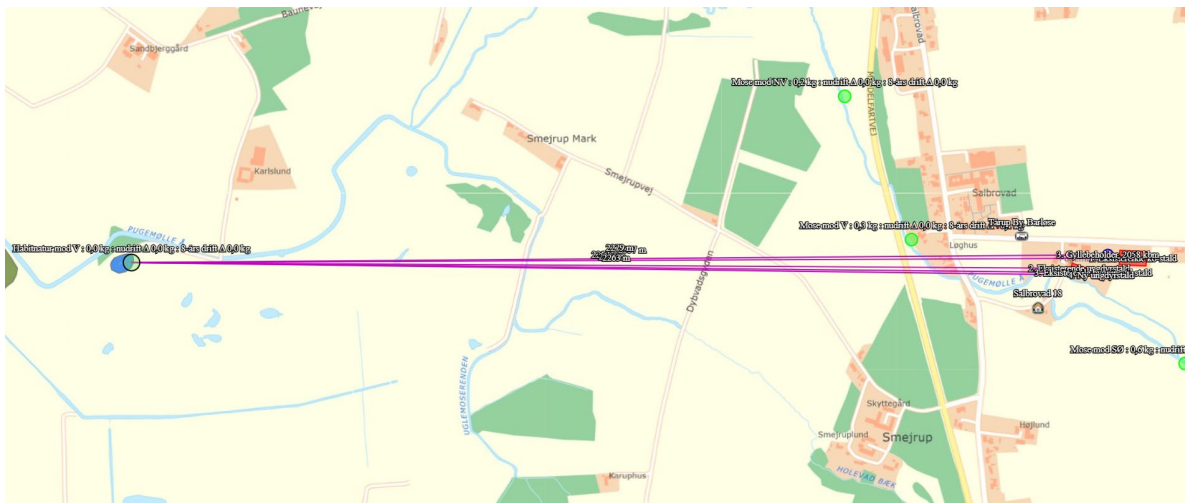
Figur 2: Placering af staldanlægget på Barløsevej 2 i forhold til nærmeste kategori 1-natur område.