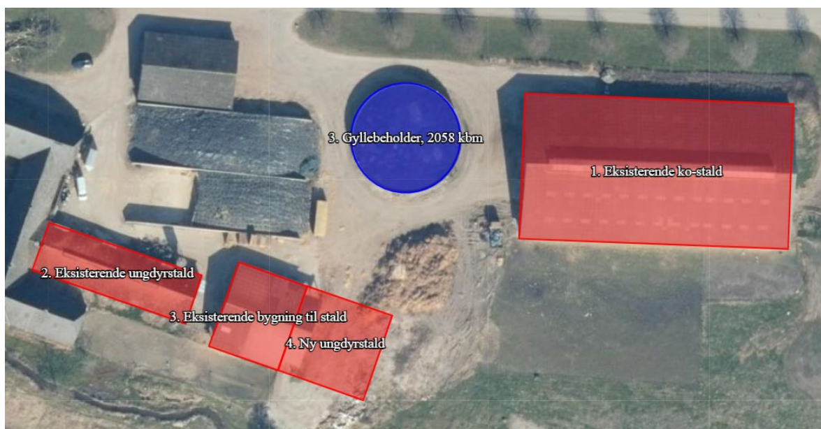
Figur 1: Oversigt over produktionsarealet (rødt) og gødningsopbevaring (blåt) på Barløsevej 2, 5610 Assens.

Den eksisterende ko-stald (1.) har et afsnit med sengestald på 889 m 2 og et afsnit med dybstrøelse på 443 m 2 . Resten af staldanlægget er med dybstrøelse. Hele staldanlægget er med naturlig ventilation. Det er den stald der hedder 3. eksisterende bygning til stald der forlænges, så produktionsarealet udvides med 400 m 2 – den nye stald hedder 4. ny ungdyrstald.