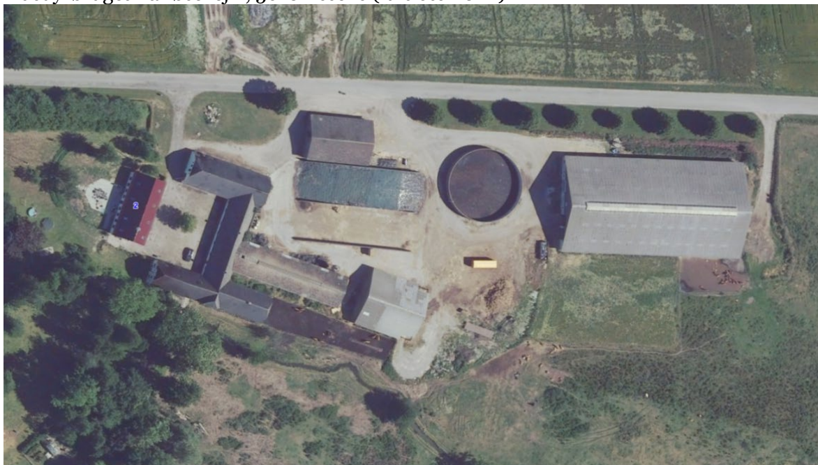
Husdyrbruget Barløsevej 2, 5610 Assens (luftfoto 2022)