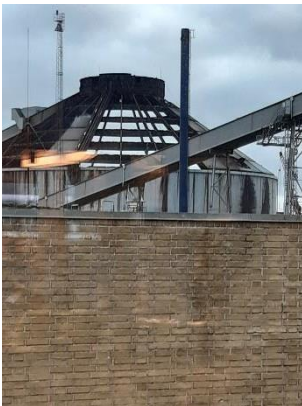
Træpillesiloen. Tagkonstruktionen er ved at blive pillet ned. Studstrupværket oplyste, at der er opsamlet ca. 7.500 m 3 slukningsvand fra branden. Vandet opbevares pt. i siloer på Aarhus havn, indtil en bortskaffelsesløsning findes. Vandet indeholder bl.a. høje niveauer af Zn og Cu, som formodes at stamme fra loftsbeklædning og kabler.