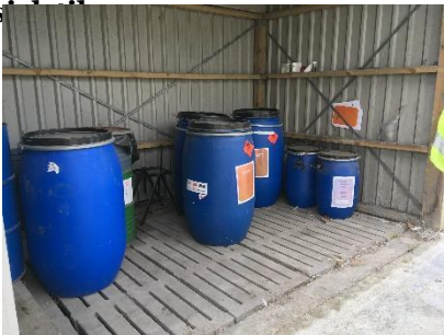
Opbevaring af flydende olie- og kemikalieaffald.