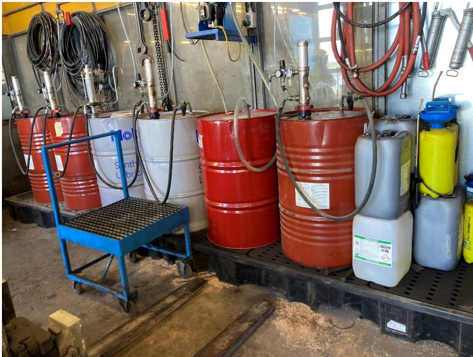
Korrekt opbevaring af flydende materiale på spildbakke i værksted v. havn

Lossetragt blev besøgt. Miljøstyrelsen har intet at bemærke til lossetragten, men der opstod spredning af støv fra tørsuger, der tømte et skib. Aalborg Portland oplyser, at tørsugeren stod af under tilsynet, hvorfor støvet blev spredt. Det blev oplyst af Stevedor medarbejdere, at tørsugeren var under reparation.