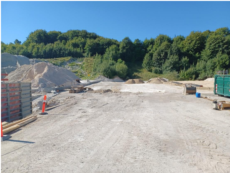
Mellemplog af oxiton