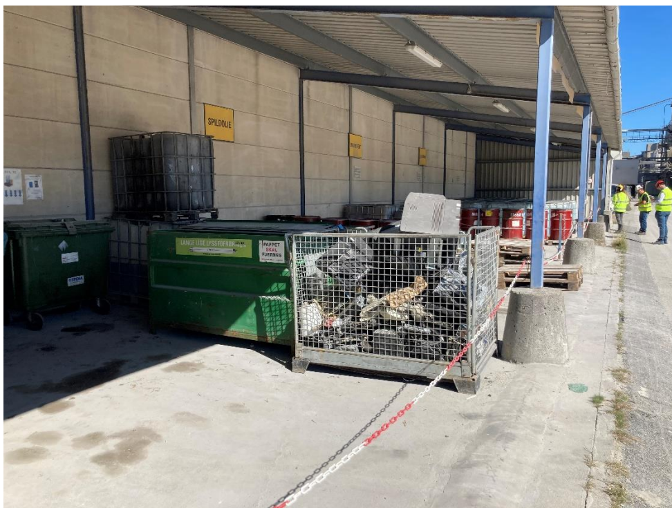
Kemikalie- og olieplads

Plads til mellemoplag (mix-plads) blev besigtiget. Aalborg Portland meddeler, at de søger flere betonklodser til opdæmning af hele pladsen samt individuelle celler på pladsen. Dele af pladsen er befæstet. Miljøstyrelsen bemærker, at GIV findes uden for befæstet areal. Aalborg Portland oplyser, at dette er et mellemlager, men at GIV bliver flyttet til befæstet areal ved HDC.