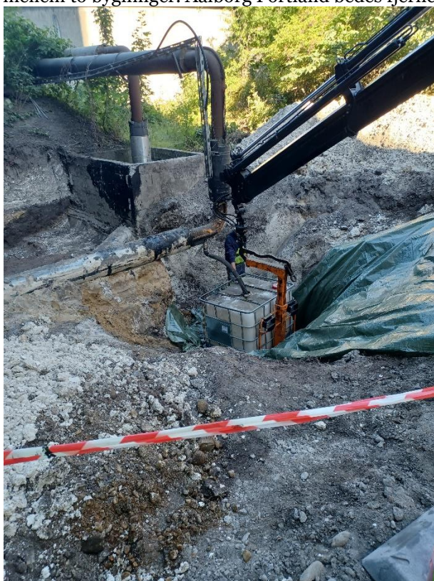
Rest af heavy fuel i røret hældes i palletank

Lokation af spild af heavy fuelolie blev besigtiget. Der gik hul på et overjordsrør, som lækkede. Aalborg Portland arbejdede på at tømme røret i palletanke. Aalborg Portland vil sikre, at alt olien er tømt ud ved brug af kameraføring gennem rørene. Aalborg Portland skønner, at der kan være op mod 15 m 3 olie tilbage i rørene. Aalborg Portland vil sende rapport over analyse af jord- og grundvandsprøve, når denne er udført. Miljøstyrelsen bemærker, at der på den anden side af vejen forekommer et lag af fint, gråt støv i et hjørne mellem to bygninger. Aalborg Portland bedes fjerne støvet.