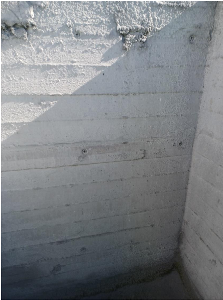
Rør til brandslukningssystem var tidligere monteret her