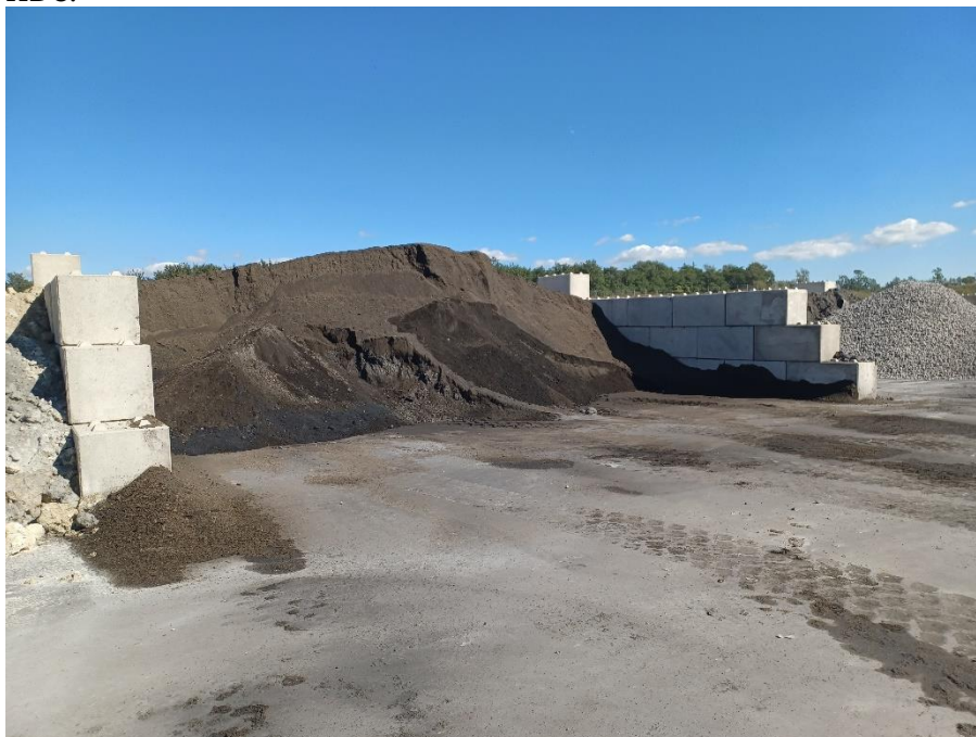
Celle på mellemoplag

Plads til mellemoplag (mix-plads) blev besigtiget. Aalborg Portland meddeler, at de søger flere betonklodser til opdæmning af hele pladsen samt individuelle celler på pladsen. Dele af pladsen er befæstet. Miljøstyrelsen bemærker, at GIV findes uden for befæstet areal. Aalborg Portland oplyser, at dette er et mellemlager, men at GIV bliver flyttet til befæstet areal ved HDC.