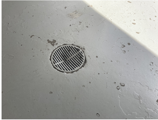
Figur 1 - Afløb fra værksted (rum 1) tilkoblet gl. olieudskiller.

gulativ, § 17, at OBU fra rum 1 skal tilmeldes den kommunale tømningsordningen, eller at værkstedsafløbet og tilkoblet OBU sløjfes.