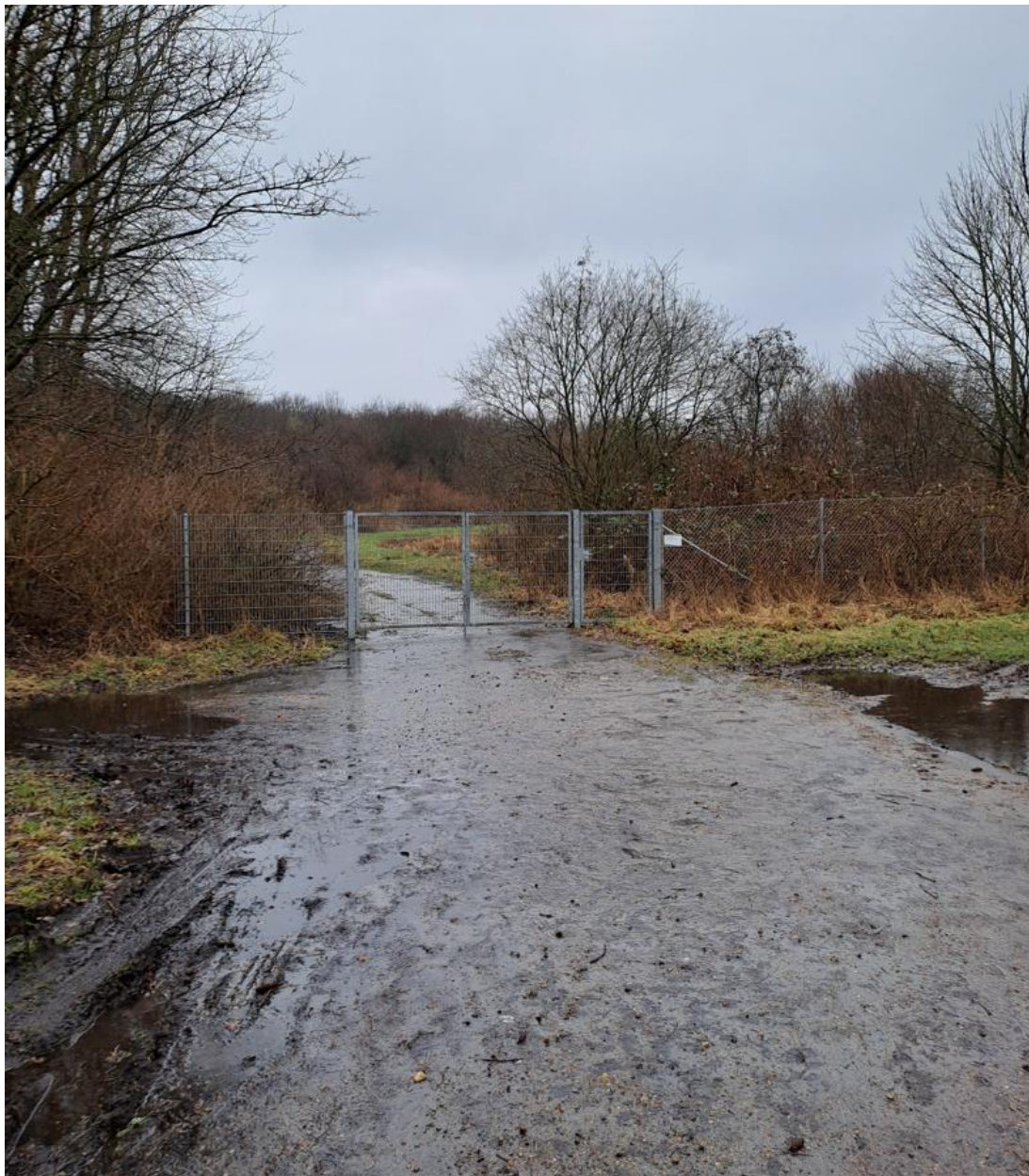
Figur 3 Vandpytter udenfor porten ind til lossepladsen.

under regnvejr, men der blev ikke observeret stillestående vand nogen steder på lossepladsen. Der var vandpytter udenfor porten ind til deponiet. Der blev ikke observeret vand i grøften rundt omkring lossepladsen.