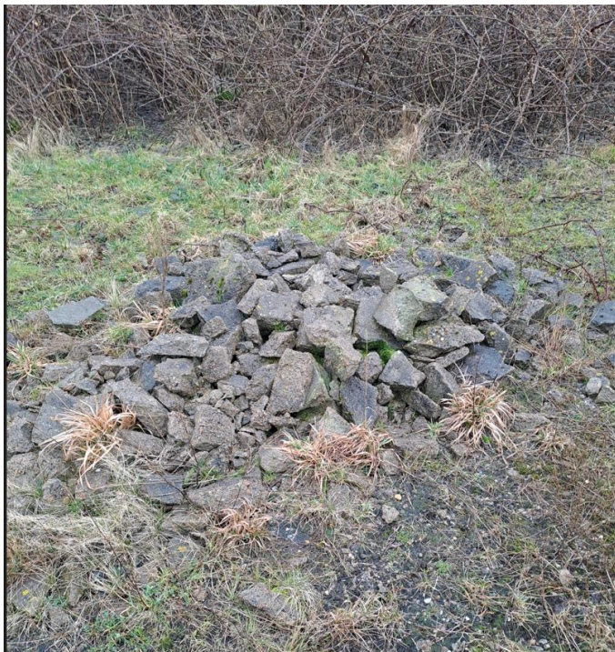
Figur 2 Bunke af brokker på toppen af lossepladsen.

Naur Losseplads er en stor bakke, hvorpå der gror græsser samt mindre træer og buske. Der er en grusbelagt adgangsvej fra bunden af lossepladsen til toppen. På toppen af lossepladsen er der et fladt område med grus, hvorpå der er en udsigtspost og mindre vendeplads. Miljøstyrelsen konstaterede, at vendeplads og omgivelserne fremstod uændrede. For at hindre affaldsdumping er den store port aflåst, hvorfor det kun er muligt at komme til toppen af lossepladsen til fods. Alligevel blev der observeret en mindre bunke med brokker på vendepladsen.