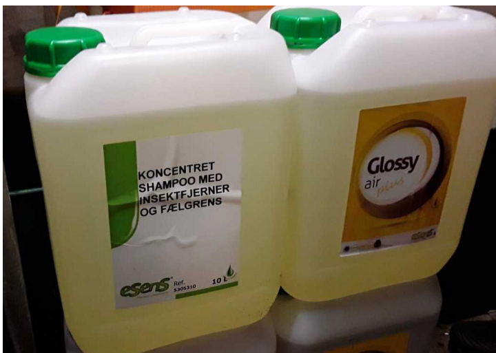
Råvarer – dunke på spildbakker i rum ved siden af vaskehal