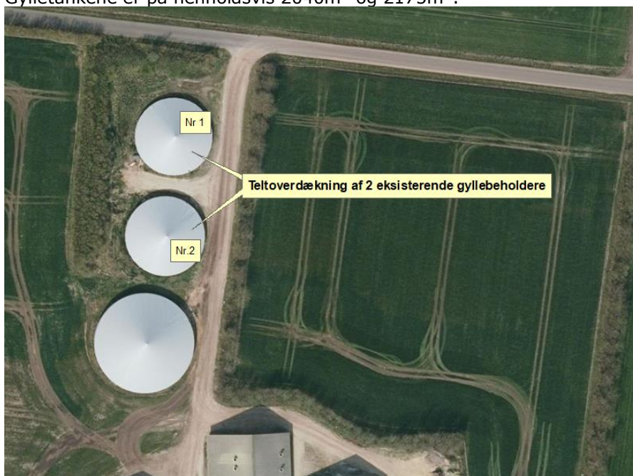
Figur 1. Ejendommen Søndersøvej 20 med eksisterende gylletanke, hvorpå der er etableret teltoverdækninger på de 2 nordligste.