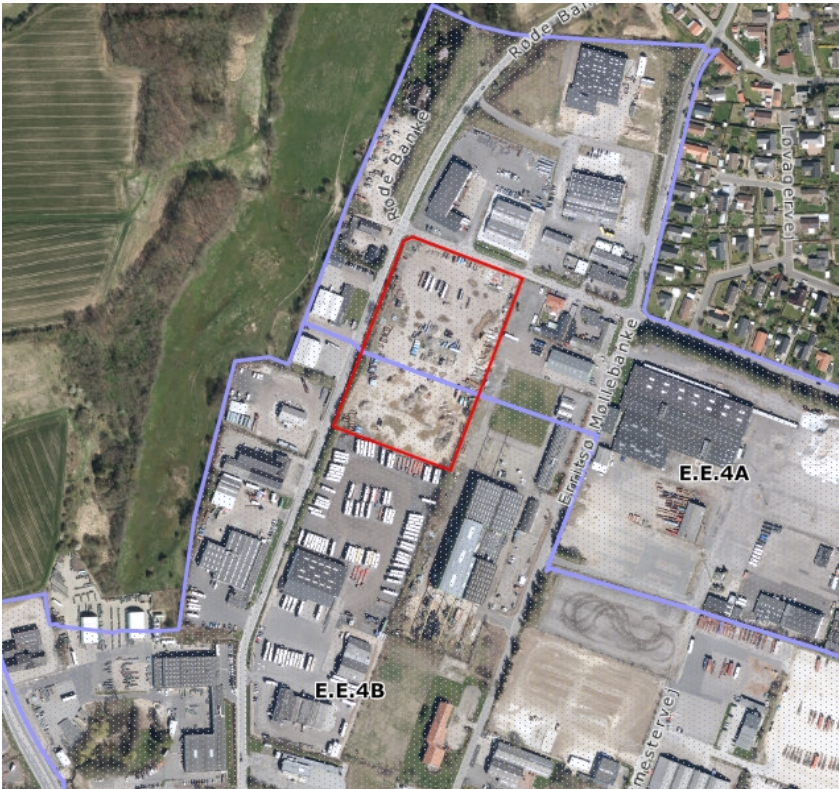
Figur 2 Oversigtskort: Røde Banke 101 – 103 er markeret med rødt.