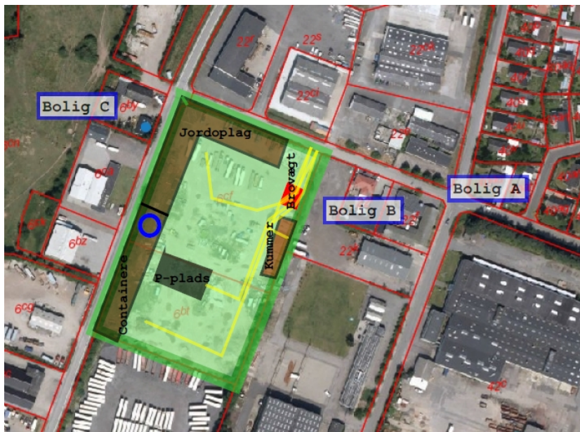
Figur 3 Oversigtskort - fast belægning er markeret med brun

Som det fremgår af ovenstående figur etableres en mindre parkeringsplads for lastbiler, som svarer til i alt 5 lastbilsture om dagen. Kørearealet er befæstet med grus.