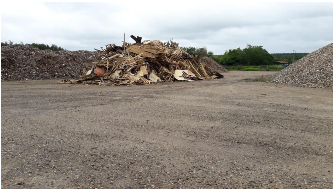
Figur 2 Oplag af træaffald på plads om nord.