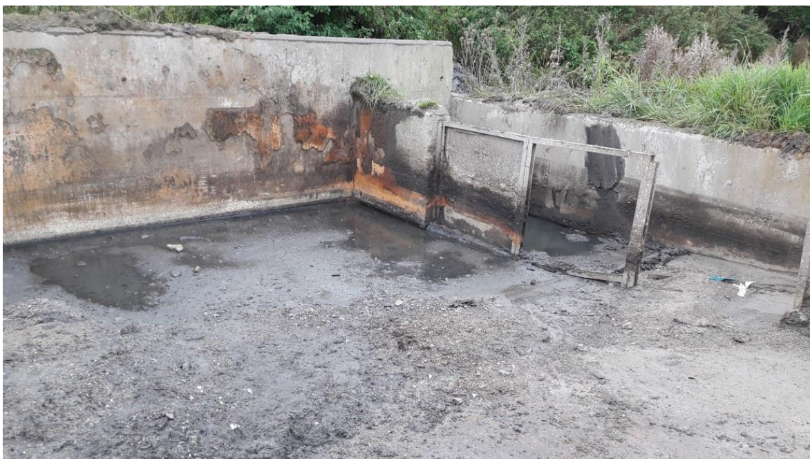
C Bassin til modtagelse af sand fra sandfang. Udløbsrør ses midt i billedet.