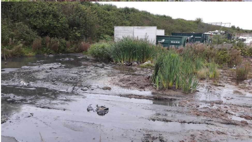
D Omkringliggende areal udenfor bassin til modtagelse af sand fra sandfang.