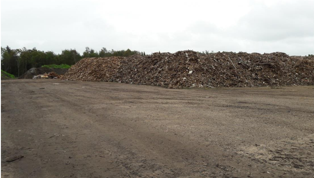
A Neddelt træaffald