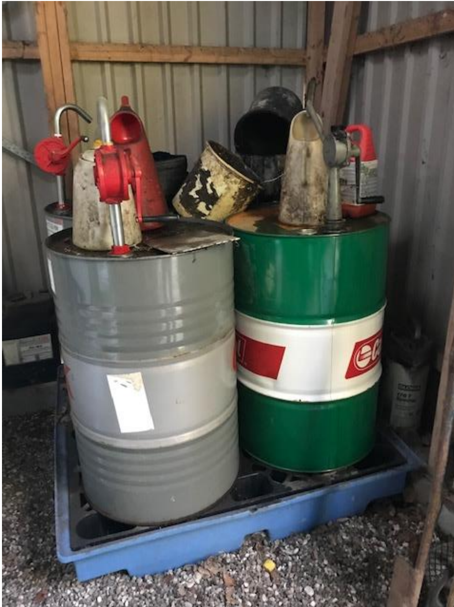
Billede 1. Virksomhedens opbevaring af kemikalier.

Virksomhedens kemikalier blev opbevaret indendørs på en spildbakke, se nedenstående billede 1.