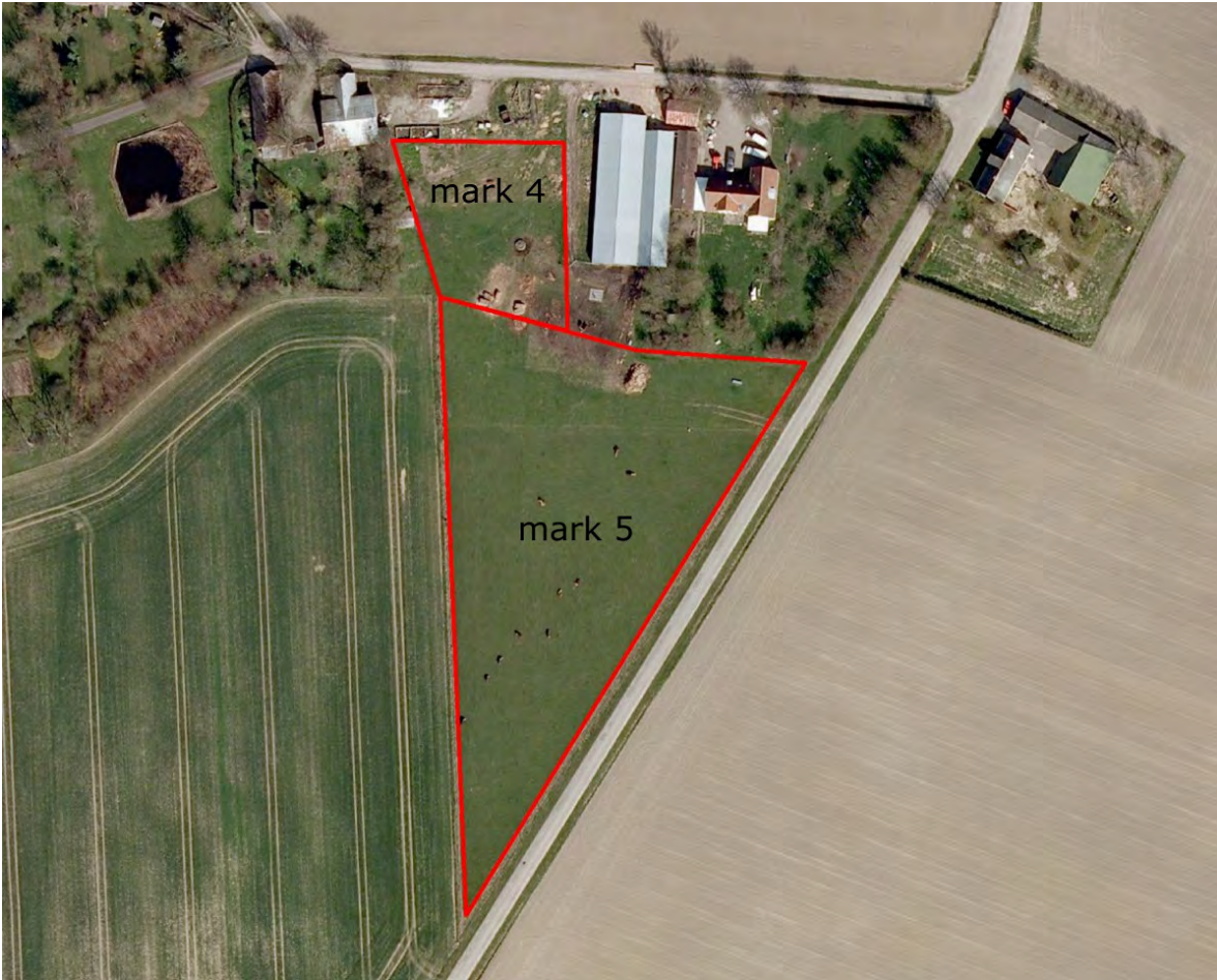
Kort over græsningsareal på Langholmvej 34