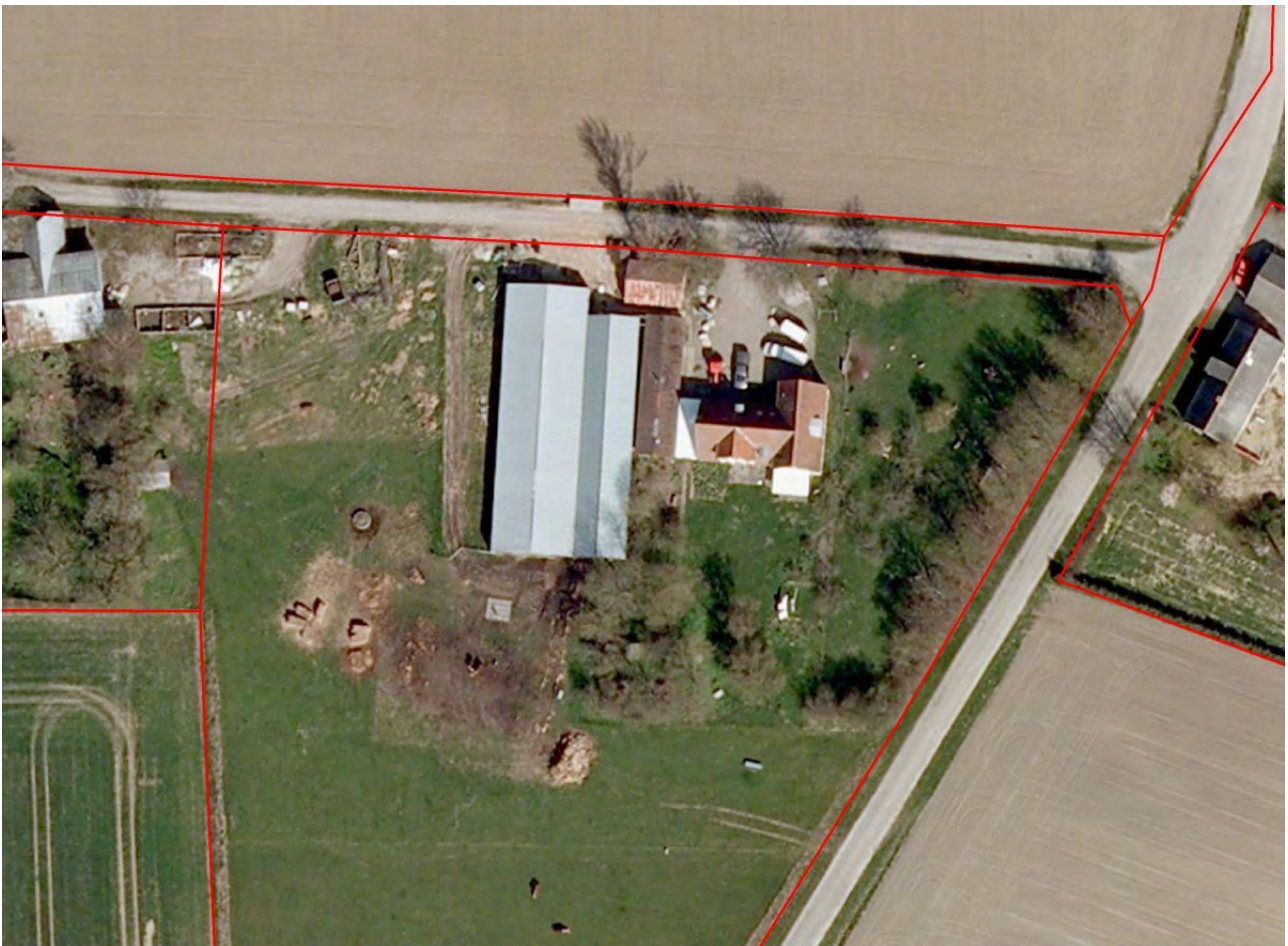
Luftfoto af ejendommen med matrikelgrænser.

Dyrene kommer på stald omkring årsskiftet, eller når vejrforholdene kræver dette. Kvæget kommer ud på græs igen i april måned, mens fårene læmmer på stald, og sættes på græs sammen med lammene i maj måned. Køerne står således på stald ca. 4 måneder om året, og fårene står på stald ca. 5 måneder om året.