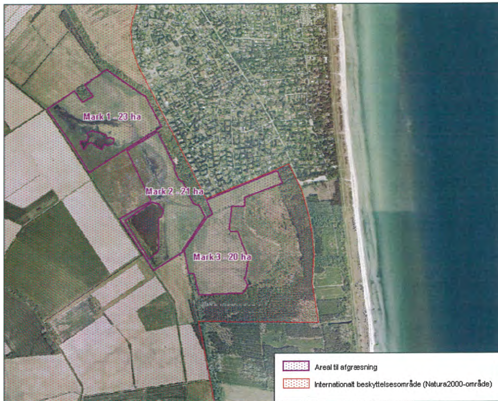
Figur 1 – Arealer til afgræsning og Natura 2000-område ved Bøtø Nor

Alle afgræsningsarealerne er beliggende inden for Natura 2000-område nr. 173 (Smålandsfarvandet nord for Lolland, Guldborgsund, Bøtø Nor og Hyllekrog-Rødsand), som bl.a. består af habitatområde nr. 152 og fuglebeskyttelsesområde F82 (Bøtø Nor). I udpegningsgrundlaget for habitatområde nr. 152 indgår flere kystrelaterede naturtyper. Indenfor afgræsningsområdet findes følgende terrestriske naturtyper knyttet til henholdsvis overgangen mellem hav og land eksempelvis strandeng/strandsump (nr. 1330), rigkær (nr. 7230) og surt overdrev (nr. 6230). Af arter på udpegningsgrundlaget vurderes det, at det kun er arter af flagermus som f.eks. damflagermus og bredøret flagermus, der vil benytte området. I udpegningsgrundlaget for F82 indgår arter af gæs og svaner, som eksempelvis grågæs, sædgæs og bramgæs, der især i vinterhalvåret raster i området. Derudover er tranen også på udpegningsgrundlaget, da den ofte raster i området omkring Bøtø Nor-søen,