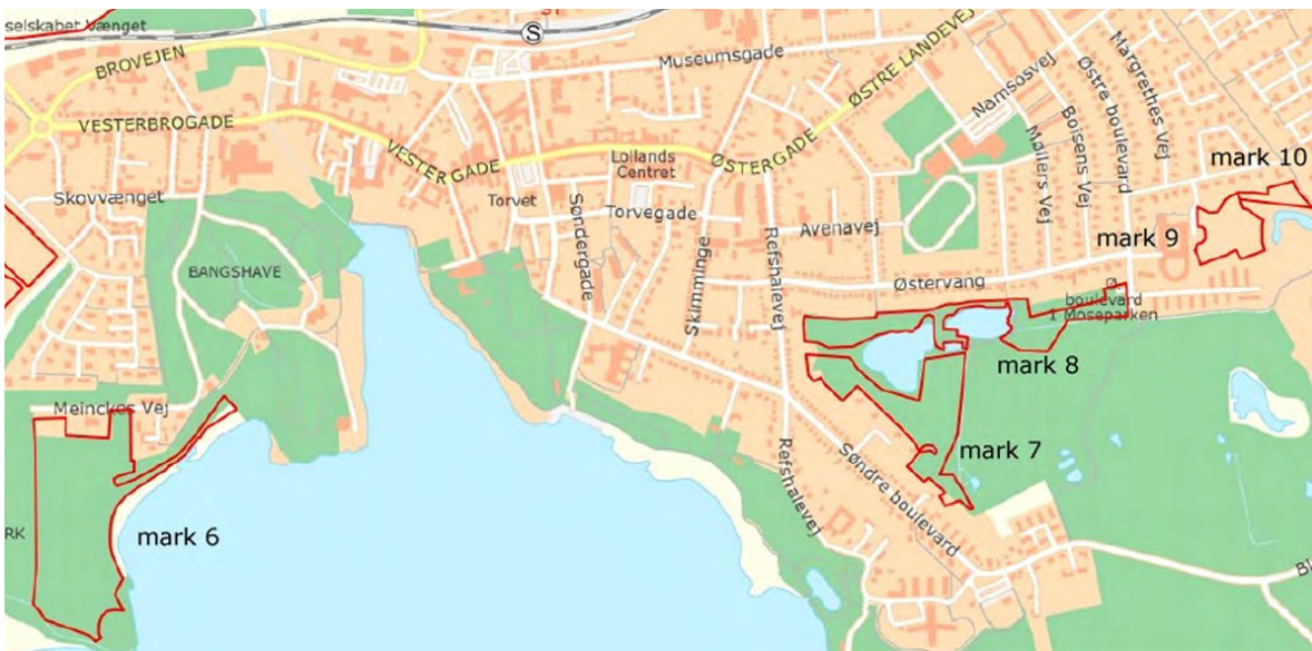
Kort over græsningsarealer omkring Maribosøerne.