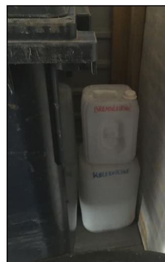
Foto af dunke med flydende affald opbevaret i affaldsrum.

Eventuel jernskrot afleveres efter aftale i nabovens jerncontainer.