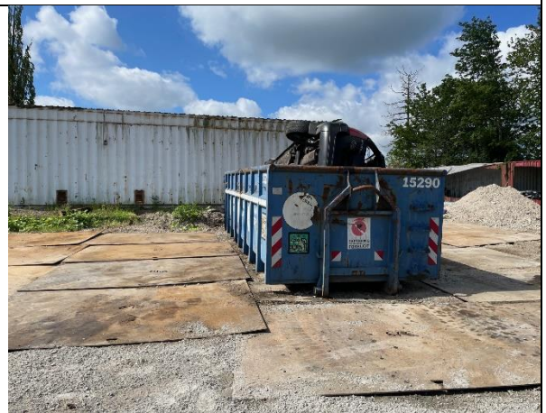
Foto 4. Der var opstillet en ny container til afhentning og flatning af karosserier.