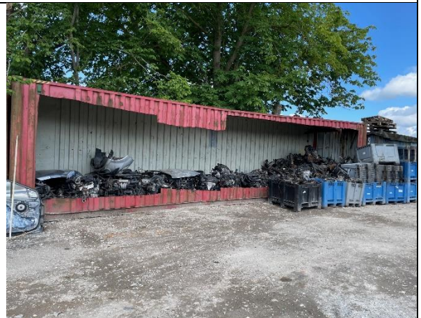
Foto 6. Der var opstillet 2 containere til oplagring af motorer og bagtøj. På den ene container manglede en presenning til afskærmning mod regn.