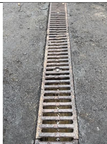
Foto 10. Billede af rensset sandfang indsendt til kommunen 19. juni 2024.