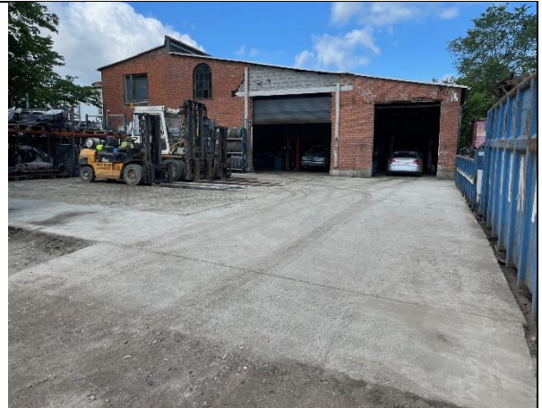
Foto 2. Der blev ikke oplagret ikke-miljøbehandlede biler på pladsen foran værkstedet.