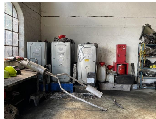
Foto 9. Der var opsat spildbakker under spildolietankene. Tankene er dog blevet meget høje, så arbejdsstillingen bliver besværlig ved aftapning af spildolie.