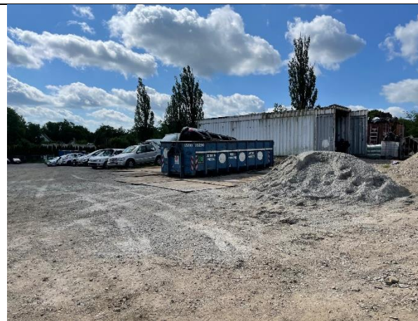
Foto 3. Der var opstillet en ny container til afhentning og flatning af karosserier.