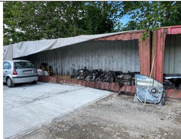
Foto 5. Der var opstillet 2 containere til oplagring af motorer og bagtøj. Der var på den ene container, opsat en presenning, som kunne afskærme for regn.