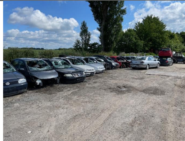
Foto 1. Containeren til karosserier til afhentning, var tidligere oplagret i dette område. Nu er der ryddet pænt op.