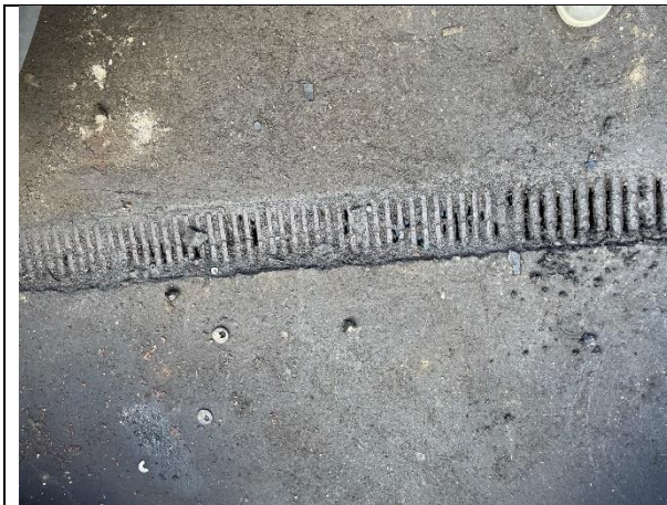
Foto 7. Afløbsristen på den betonstøbte plads var delvist stoppet til.