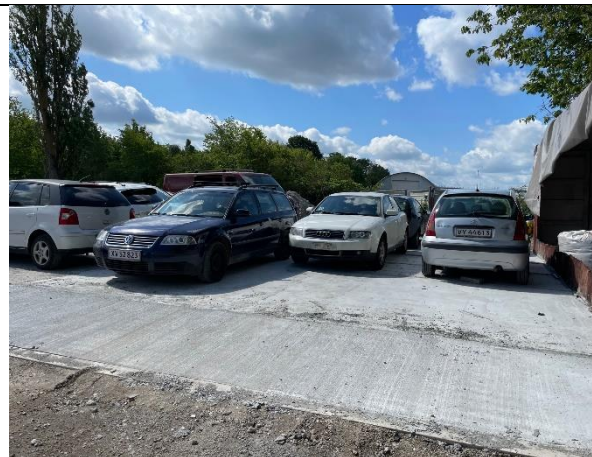
Foto 8. Den betonstøbte plads til oplagring af ikke-miljøbehandlede biler var blevet udvidet med ekstra 100 m 2 .