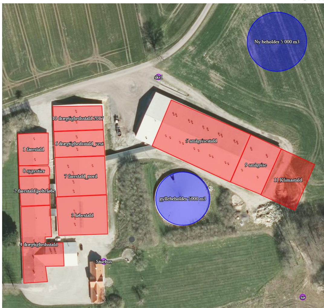
Figur 1: Oversigt over produktionsarealer på Gamtoftevej 54, 5610 Assens.

En oversigt over størrelsen på de enkelte produktionsarealer findes i ansøgnings-skemaet (nr. 215539) på side 3.