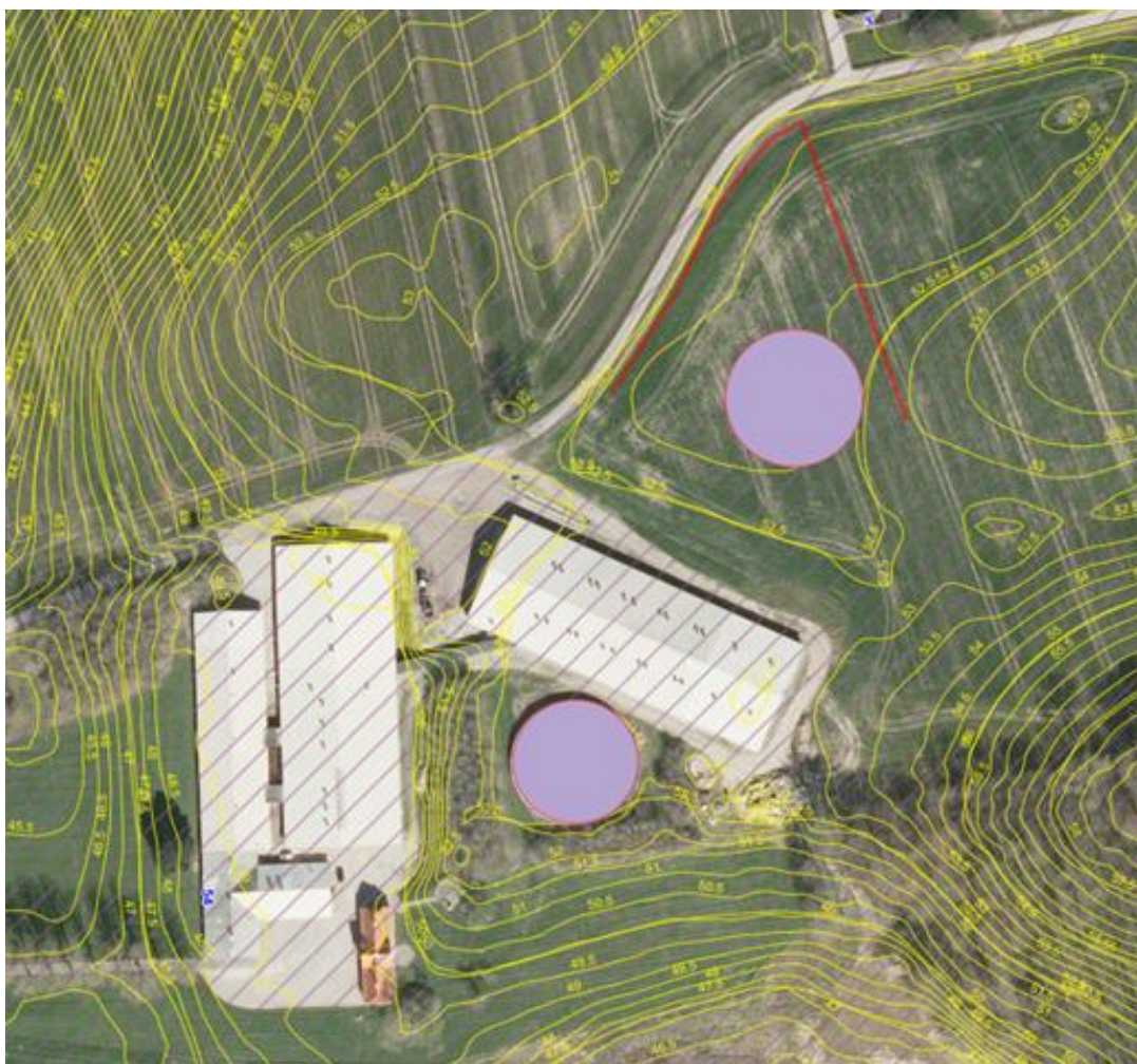
Figur 2: Terrænforhold og markering af det enkeltrækkede hegns placering.

Derudover er der med denne ansøgning søgt om en gyllebeholder med teltoverdækning, og for at beskytte de landskabelige værdier vurderer Assens Kommune, at teltoverdækningen skal være i en afdæmpet og ikke reflekterende farve.