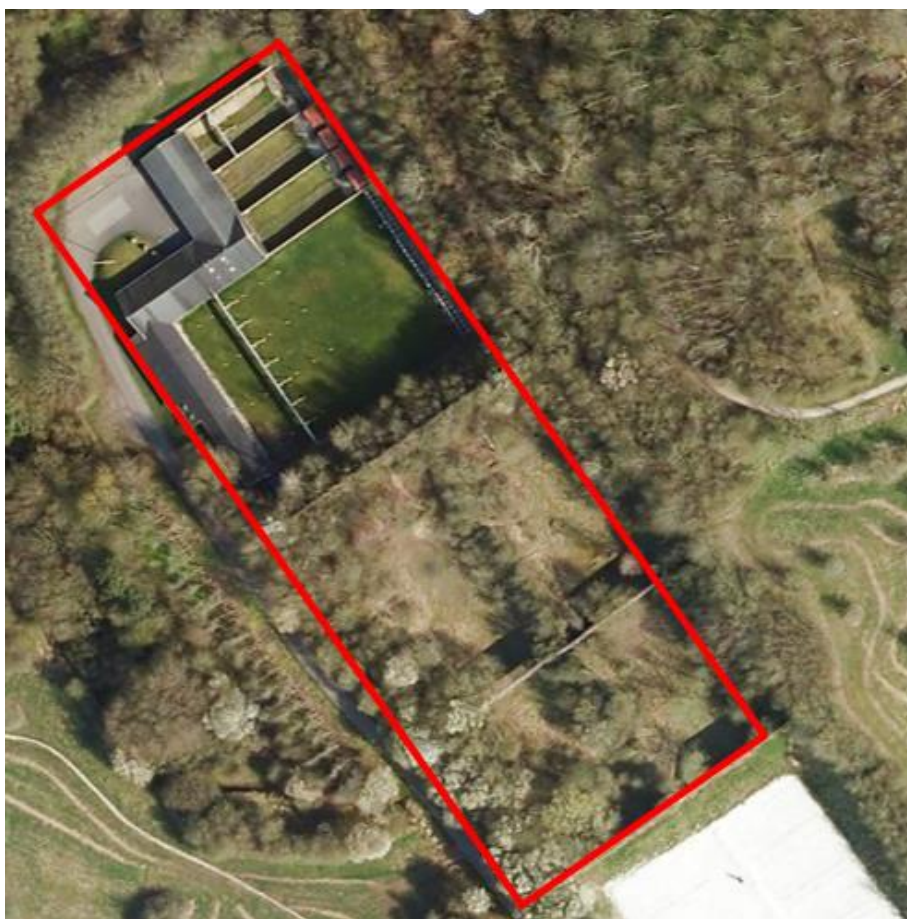
Luftfoto af skydebanen med planlagt udvidelse til biathlon

Vestereng Skydebane består p.t. af to skiveskydningsbaner i form af en 25 meter pistolskydebane med 30 standpladser fordelt på 3 afsnit med hver 10 pladser, og en 50 meter skydebane med 30 standpladser til skydning med salonpistol og salongevær. En godkendt udvidelse af skydebaneanlægget med en 50 meter skydebane til biathlon er næsten færdigetableret og tages i brug i løbet af kort tid. Biathlon er en disciplin i kombineret løb og skydning med salonriffel efter skydeskiver. Banen er etableret på et afgrænset område, der ligger umiddelbart sydøst for skiveskydningsbanerne – se luftfoto herunder - nord for sandbane til beachvolley.