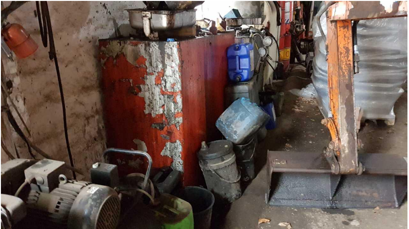
Spildolietank opstillet med spildsikring (støbt betonkant på gulvet).