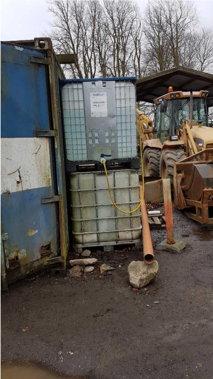
AddBlue opbevares udendørs i en palletank uden spildsikring.