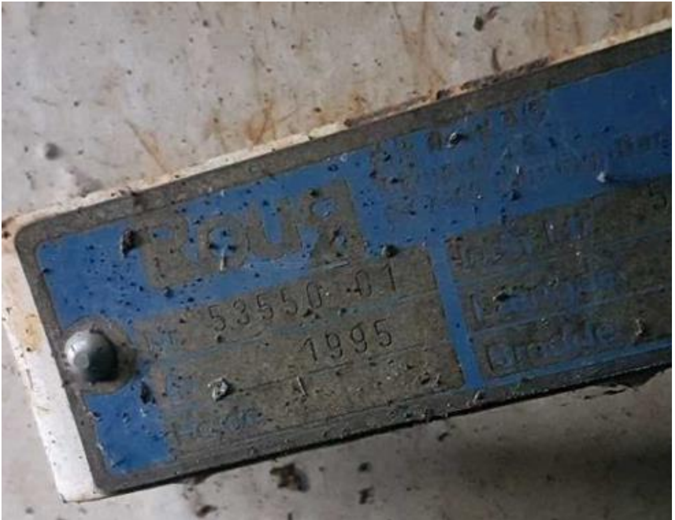
Tankplade på dieseltank (traktordiesel) fra 1995.