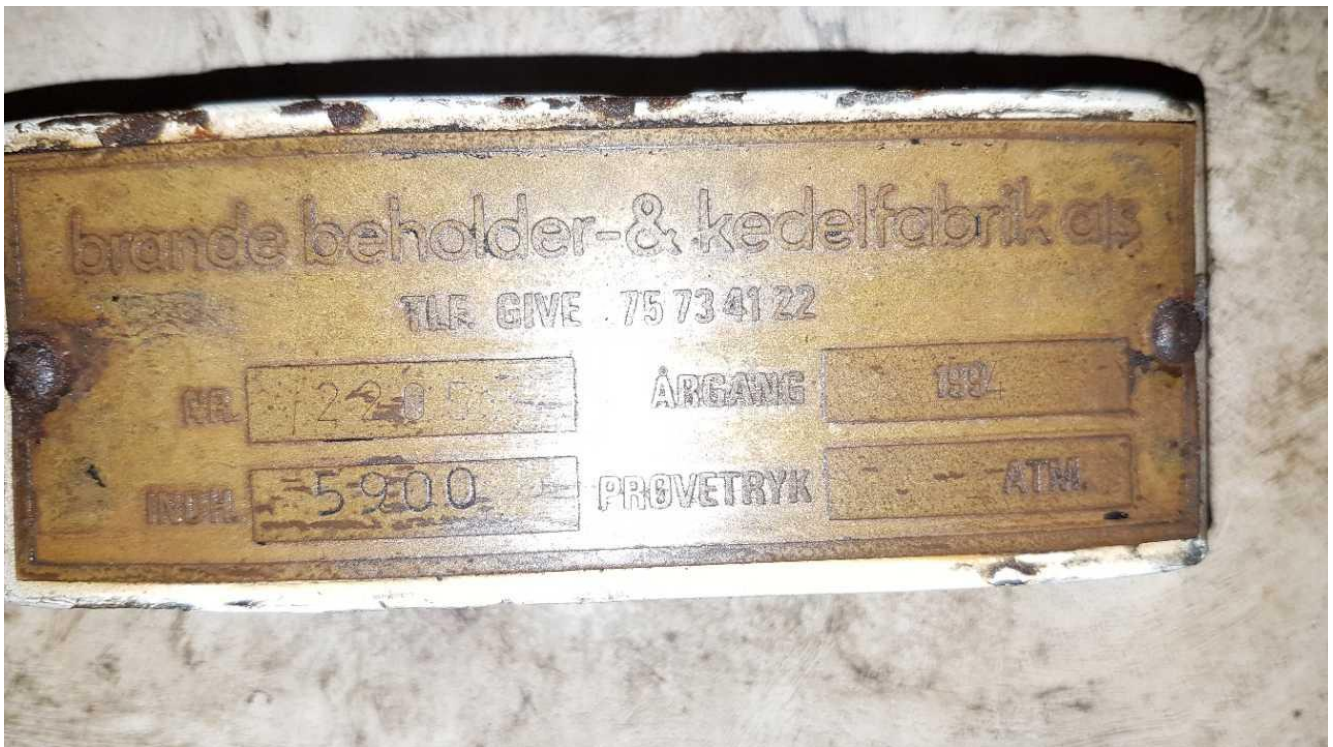
Tankplade på dieseltank fra 1994.