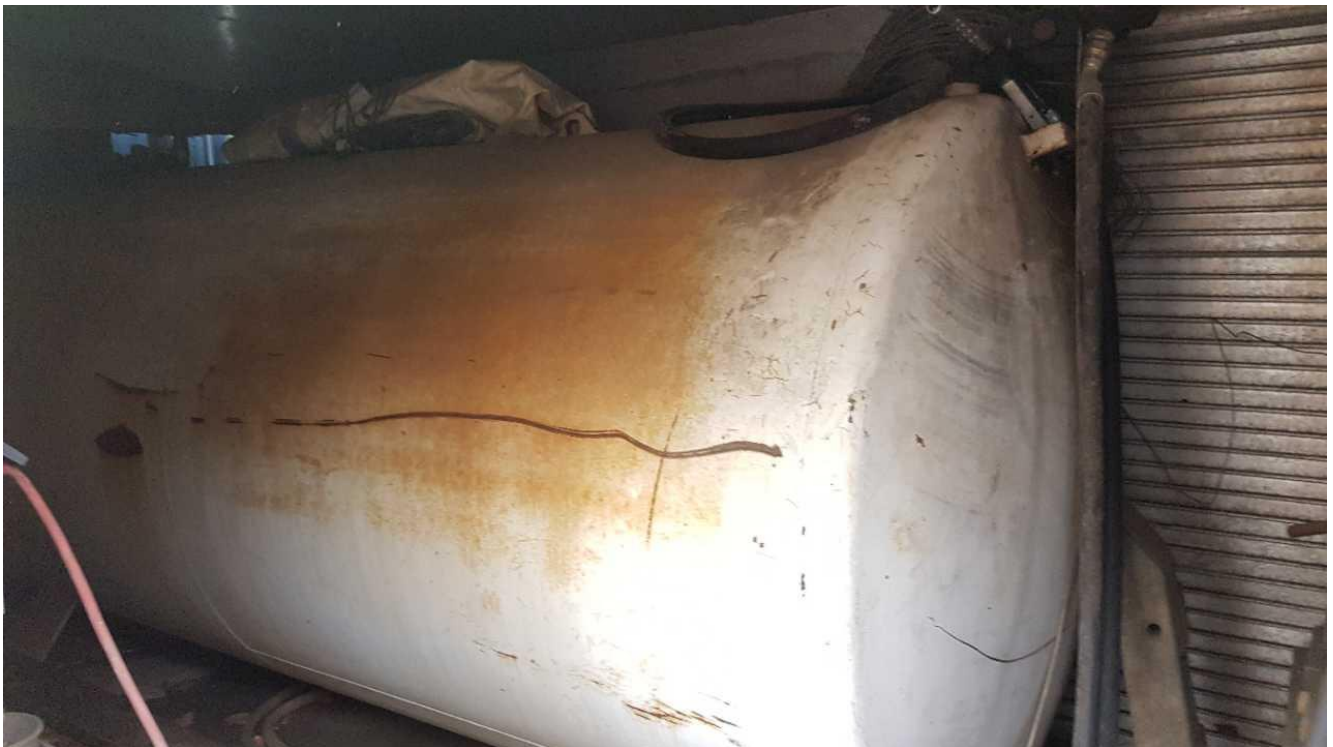
Dieseltank med pistol opstillet i container.