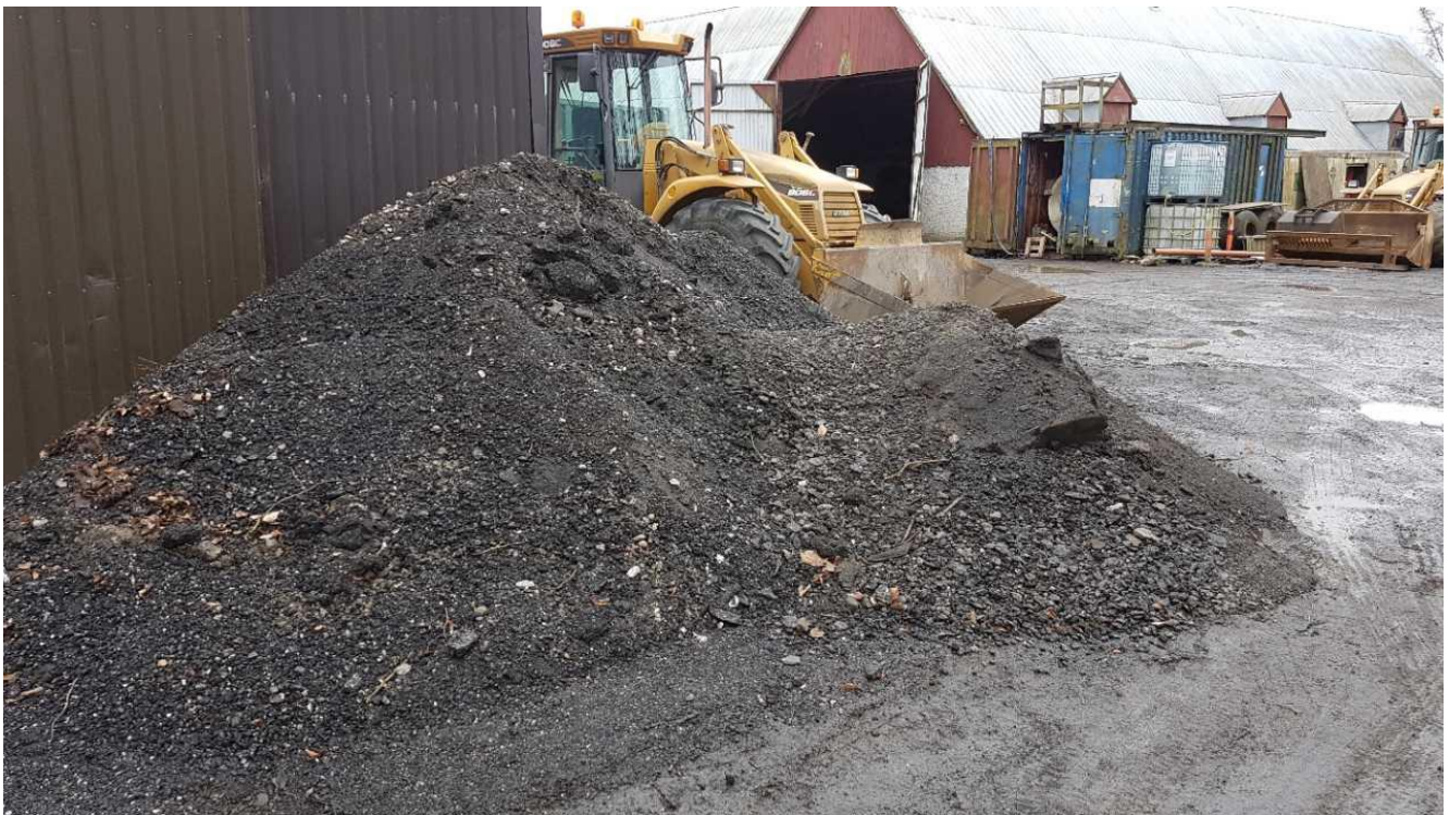
Opbevaring af bunke med fræset asfalt der er opsamlet med fejebil.