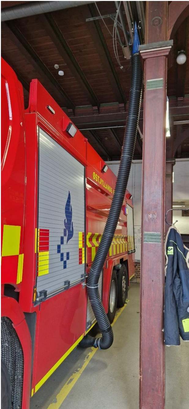
Alle udrykningskøretøjer har konsekvent påmonteret udsugning på køretøjernes udstødninger.