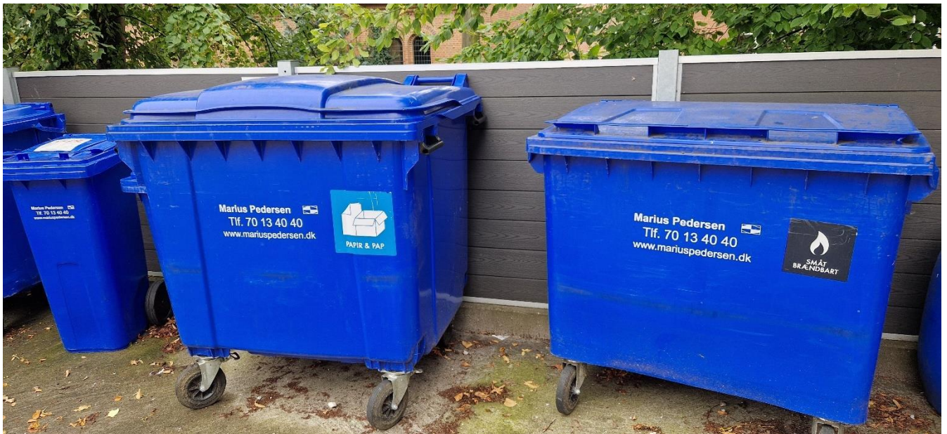
Papir & pap samt småt brændbart