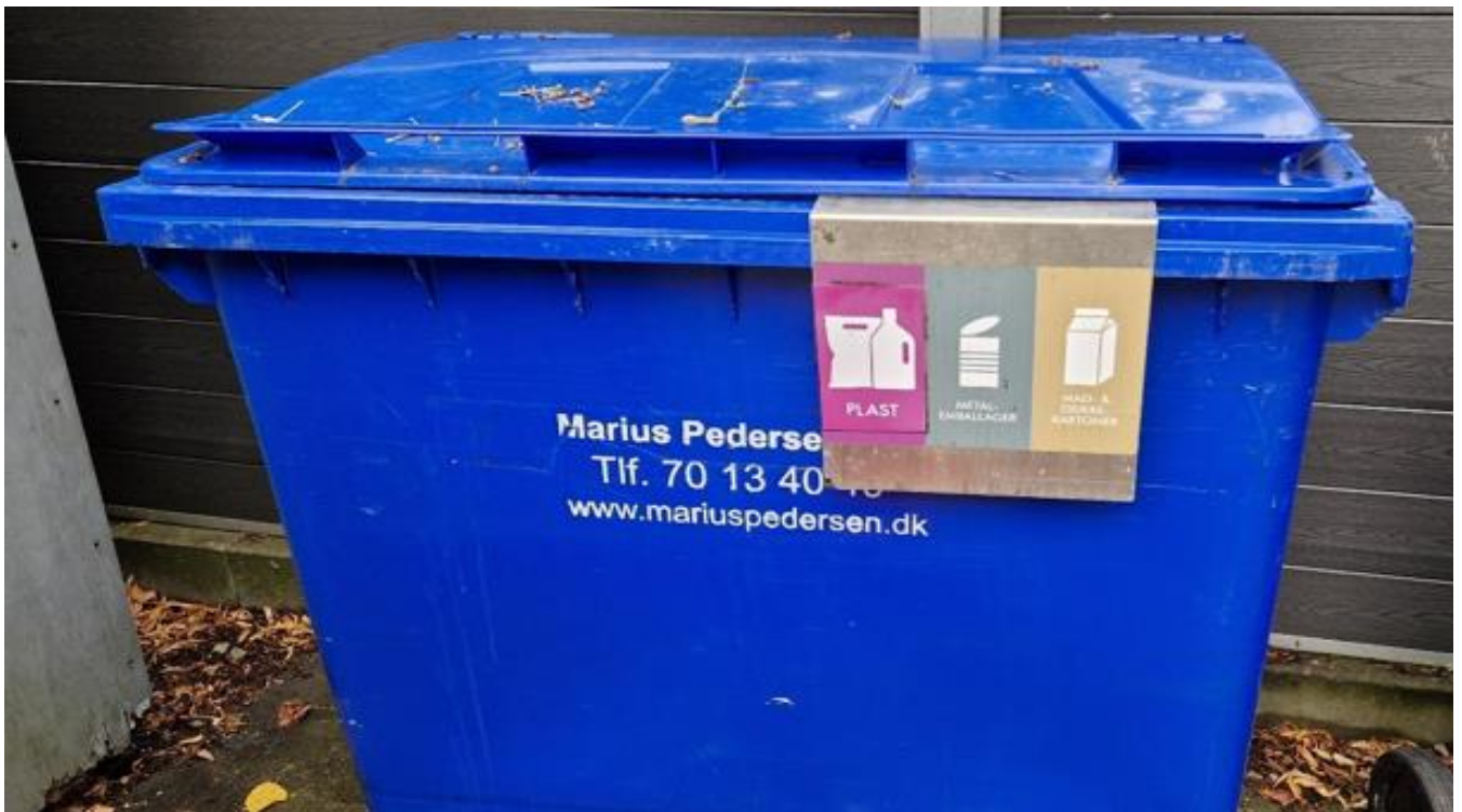
Plast, metalemballage, mad- & drikkekartoner