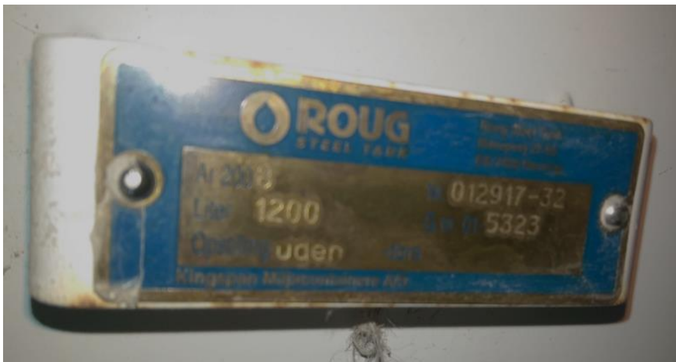
Tankplade på den nye olietank.