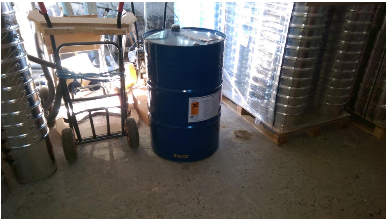
Opbevaring af polyester i tromle forekommer tæt på port.