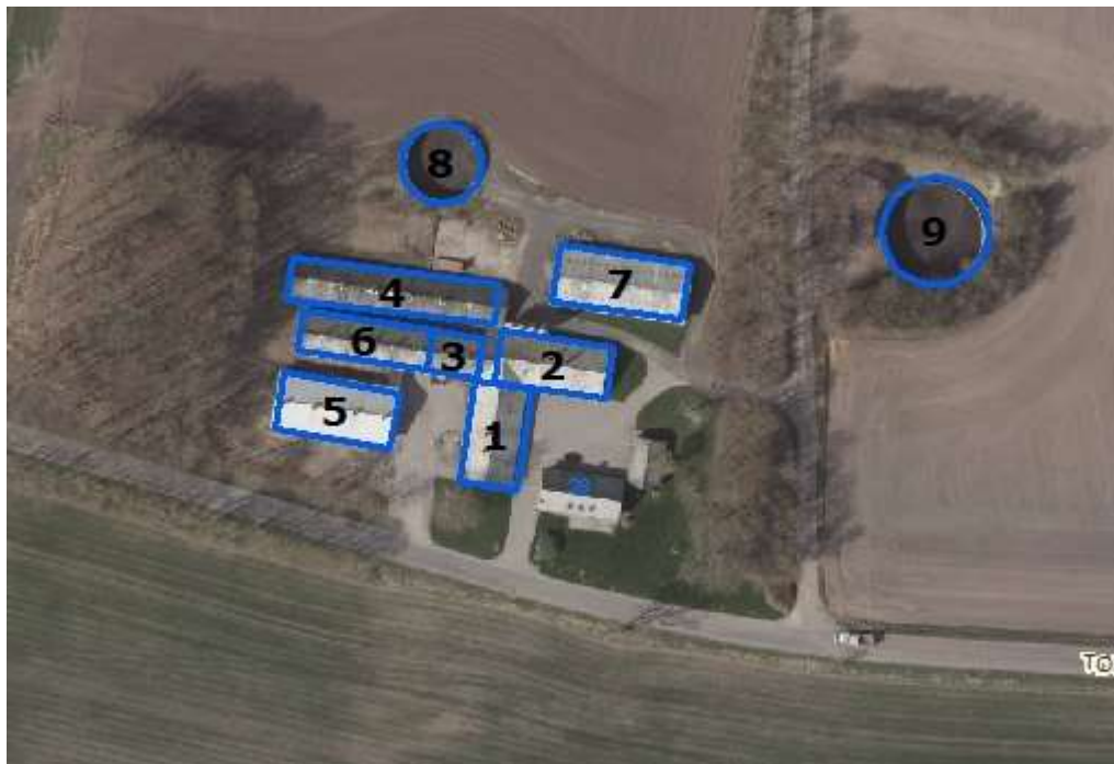
Figur 1. Husdyrbrugets driftsbygninger

Der er følgende produktionsbygninger på ejendommen: