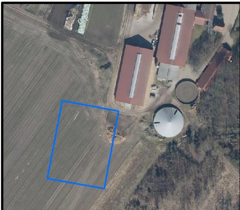
Figur 2. Ny ønsket placering af plansiloområde.