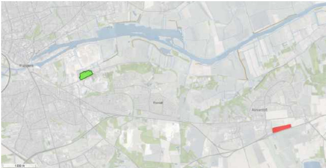
Kort 1. Placering af Virkevangsbassinet er vist med rødt. Centralrensningsanlægget er vist med grønt.