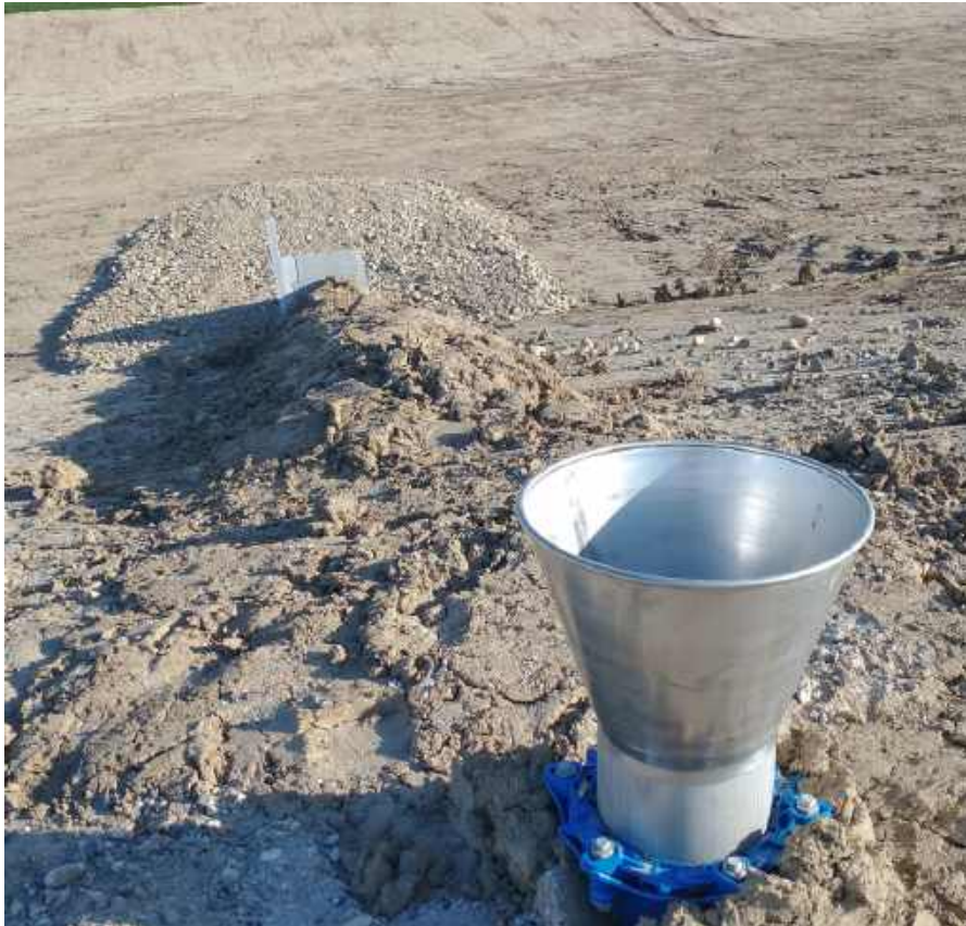
Billede 1. Bygværk til påfyldning og opsugning. Der er en tragt foroven på toppen af volden. Der er et skjult rør som udmunder nede i stenbedet. Stenbedets funktion er, at sprede vandet diffust ud, så man undgår erosion af bunden af bassinet. Membranen under bassinet holdes på plads af bundmaterialet. Der er også membran inde i brinkerne. Se vilkår 10-13 for påfyldning og opsugning i afsnit 1.2.3 – Brug af anlægget.

Der er en intern kørevej bag en vold og fra kørevejen kan der påfyldes spildevand på hvert af bassinerne via et bygværk, der reducerer risikoen for erosion af bassinbunden over membranen.