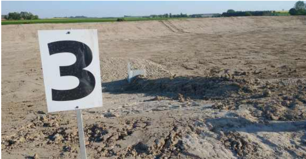
Billede 2. Der er stillet tydelige markeringer af de forskellige bassiner op ved bygningsværkerne til levering af spildevand, så vognmænd/entreprenører kan orientere sig.