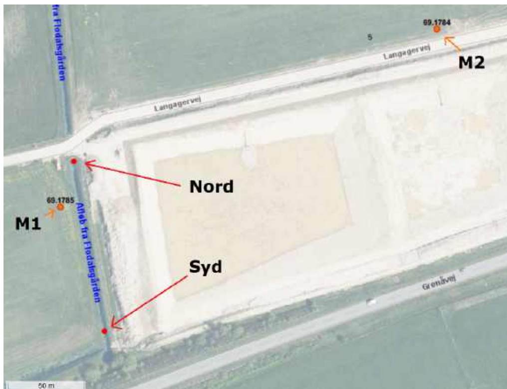
Kort 3. Placering af prøvetagningsstederne nævnt i vilkår 16 - 18. Nord og Syd er prøvetagningssteder i grøften og M1 samt M2 er monitoringsboringerne på hhv. 23,5 og 25 m dybde. Der kommer overfladevand fra øst langs Langagervej via regnvandsledning som munder ud i grøften få meter syd for Nord prøvetagningsstedet.