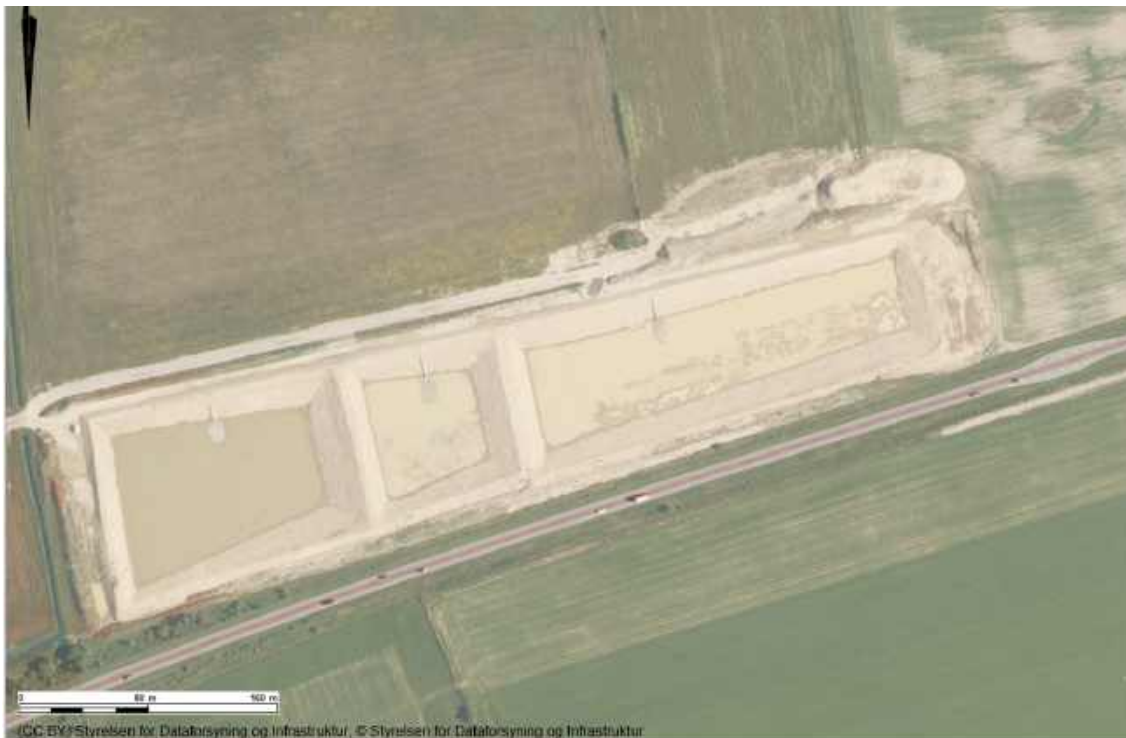
Kort 2. Virkevangsbassinet, luftfoto primo-medio maj 2024. Man kan ænse de tre stenbede i bassinerne, som der er billede af på side 21.