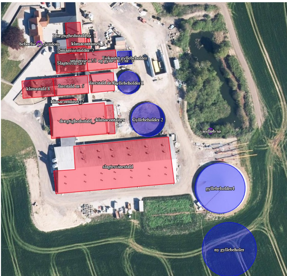
Placering af gyllebeholder.

Placering af gyllebeholderen er vist på nedenstående oversigtstegninger.