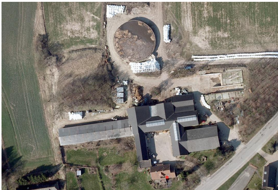
Figur 1. Serridslevvej 41. Orthofoto 2010. Før ændringerne gennemføres (ny halmlade og velfærdsudvidelse samt etablering af besøgsaktivitet). Der var bl.a. wrap og halm oplag ved den vestlige stald, samt nord for bygningerne og gyllebeholder.

*Antal DE er beregnet efter den omregningsfaktor der var gældende i marts 2009, hvor der blev meddelt en § 11 godkendelse til 125 jerseykøer, 130 opdræt og 75 småkalve. Dengang svarende til 172,91 DE, hvilket i dag svarer til 205 DE.