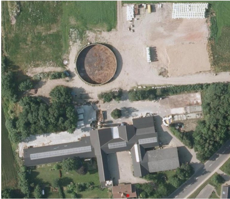
Figur 2: Serridslevvej 41, Orthofoto 2012 (Geodatastyrelsen). Der er etableret befæstning af arealet langs ved den vestlige stald (hvor der tidligere var oplag af halm og wrap). Halmladen er under forberedelse. Der er lavet en forbedret udkørselsvej mod øst. Dele af velfærdsudvidelsen er under gennemførelse (udhæng lavet).

Den 8. juni 2012 kvitterede Horsens Kommune for en anmeldelse af et mindre dyrehold tilhørende Børnebondegården, som forventes af ville bestå af ca. 20 stk. høns, ca. 25 stk. kaniner, ca. 12 stk. får/geder, ca. 40 stk. ænder/gæs, ca. 2 stk. søer med tilhørende smågrise og 8 stk. slagtesvin. Der kan være variation i antal og sammensætning, men samlet vil dyreholdet ikke være større end 3 DE. Det blev vurderet at dyreholdet, med baggrund i dyreholdets størrelse og sammensætning, samt at det drives uafhængigt af den eksisterende kvægproduktion, var af bagatel- og hobbypræget karakter, set i forhold til den eksisterende godkendte husdyrproduktion på ejendommen. Dermed udløser det ikke krav om et tillæg til § 11 miljøgodkendelsen på ejendommen.