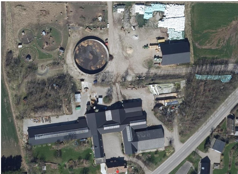
Figur 4: Serridslevvej 41, Orthofoto forår 2016 (Geodatastyrelsen). Halmlade er opført. Område til besøgsaktiviteter er lavet ved ejendommens vestlige del, hvor der er meddelt landzonetilladelse.

Den 7. september 2012 accepterede Horsens Kommune efter en anmeldelse efter § 19 i husdyrgodkendelsesbekendtgørelsen, at der kunne etableres en ny halmlade på ejendommen. Begrundelse for at opføre bygningen var, at halmladen skulle anvendes til halm, der skulle bruges i den daglige drift af kvægproduktionen. Laden skulle erstatte det udvendige halmoplæg samt halmopbevaring i eksisterende bygninger (maskinhus og stald). I forbindelse med opførelsen af halmladen blev der ikke foretaget godkendelsespligtige ændringer som f.eks. ændringer eller udvidelser af dyreholdet. Afgørelsen blev senere stadfæstet i 2013 (NMK-134-00048).