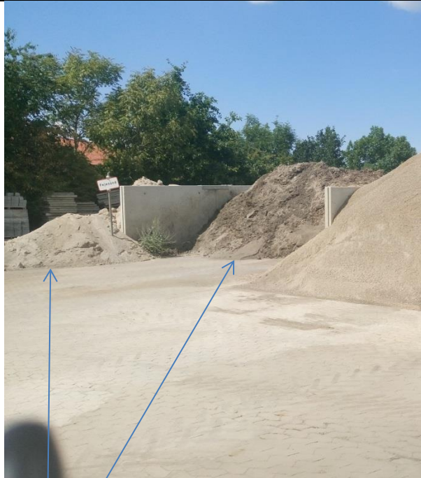
Fejesand og jord, 2018