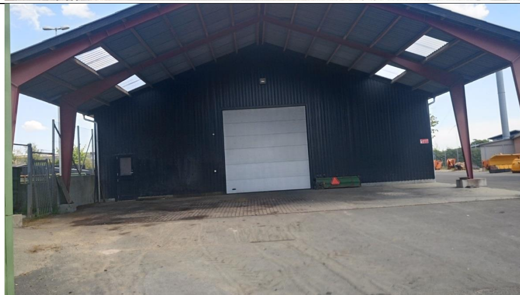
Ny vaskeplads, Lerbakken 9, 2018