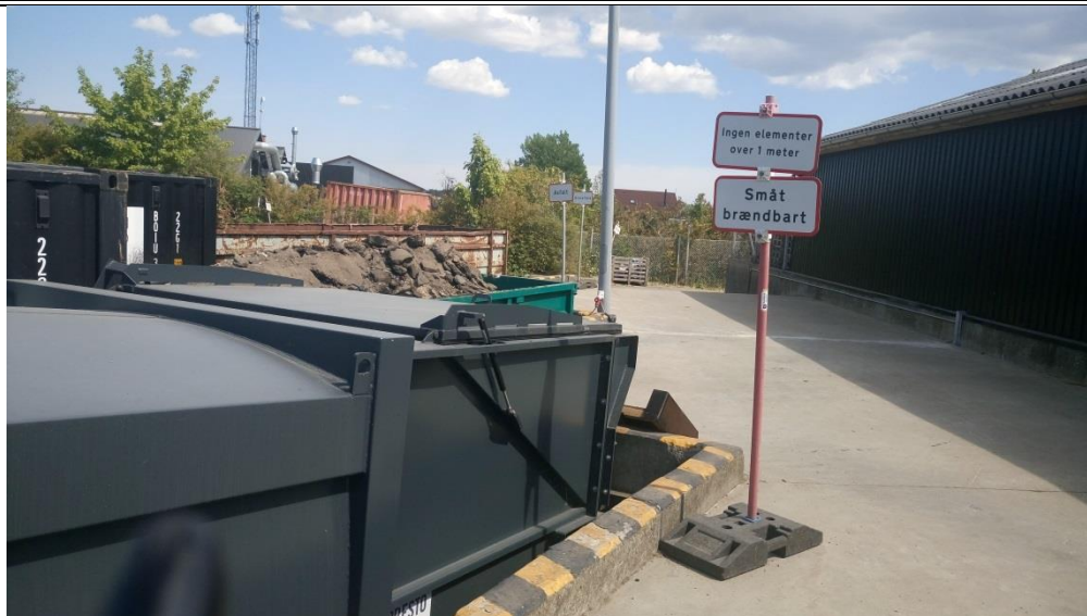
Containere til småt brændbart og asfalt, 2018

Det vurderes, at oplaget af affald kræver miljøgodkendelse. Se nærmere i tilsynsbrevet.