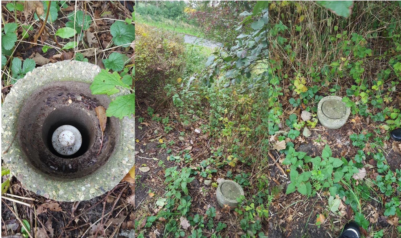
Billede 5 OB2, DGU. 132.2224