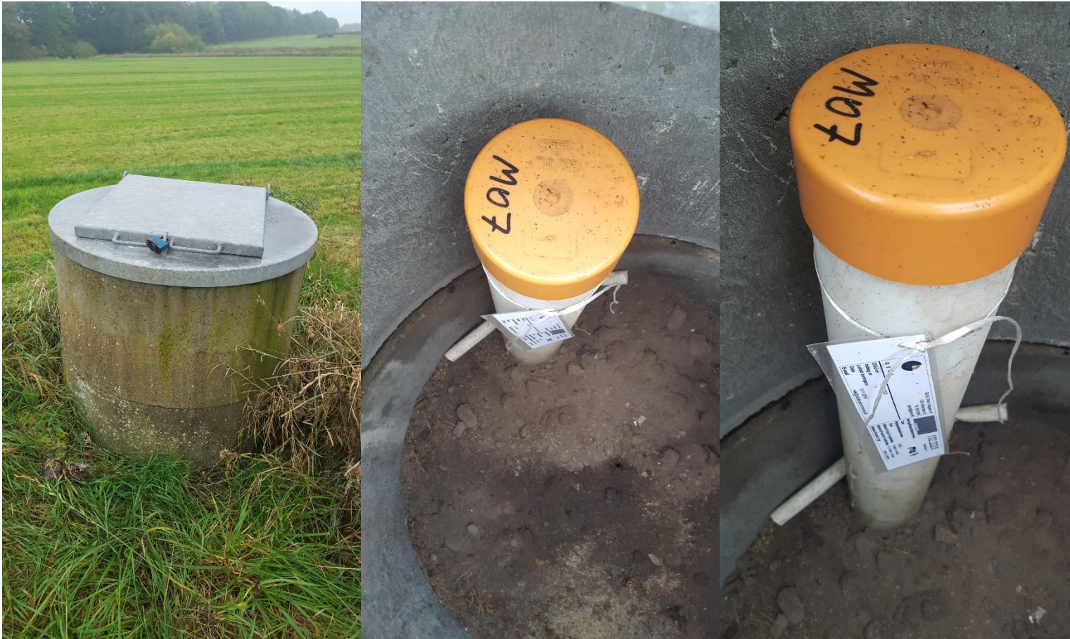
Billede 6 MO7, DGU. 132.2223