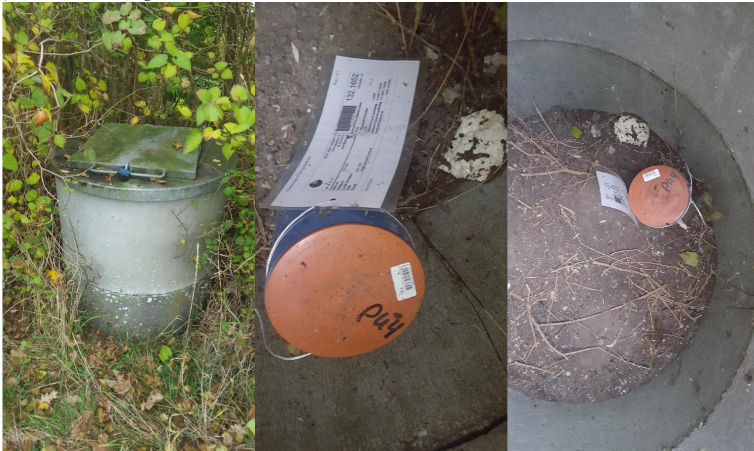
Billede 1 PU4, DGU.132.1652