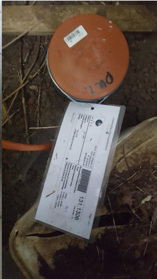
Billede 4 PU1, DGU. 131.1306