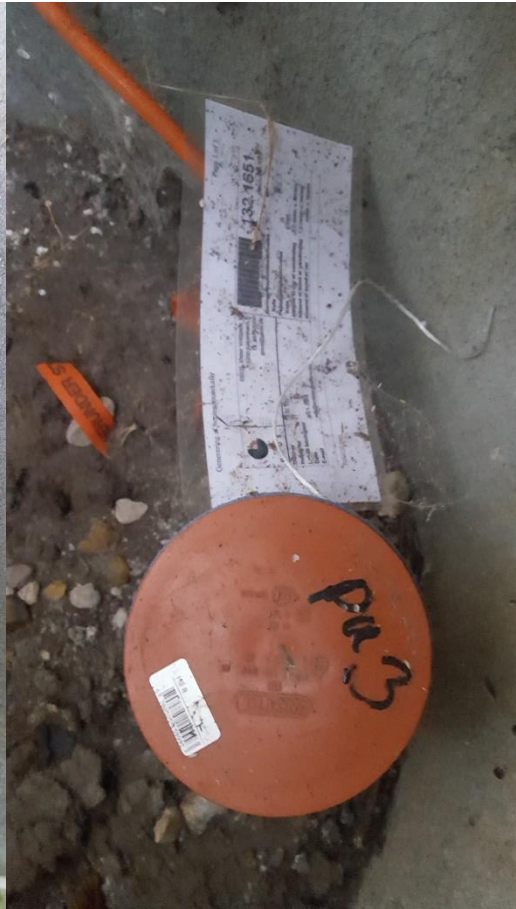
Billede 2 PU3, DGU. 132.1651