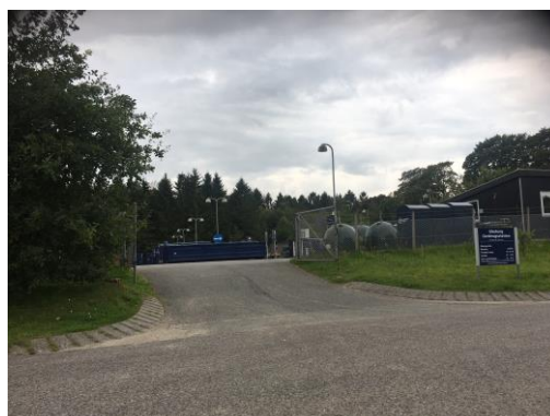
Billede af Glesborg Genbrugsstation

Virksomheden modtager diverse affaldsfraktioner fra borgere og erhverv. Virksomheden sørger for, at den videre håndtering/bortskaffelse af affaldet sker på en miljømæssig korrekt måde.