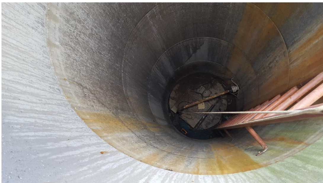
Billede 3 Perkolatbrønden – Tilsynsførende kunne ikke høre at pumpen var aktiv. Pumpen burde starte automatisk, når vandstanden når en indstillet højde.