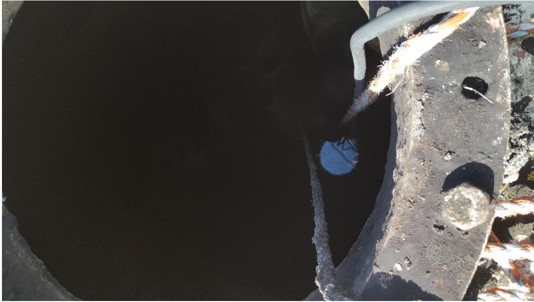
Billede 4 Perkolat tanken, der har et vandspejl.