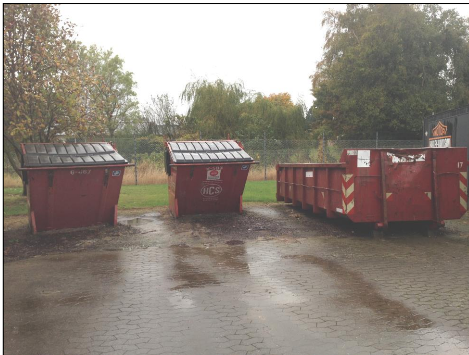
Foto af virksomhedens affaldsområde med de opstillede containere. Området er bag danseskolens bygning.

Virksomheden er tilmeldt ordningen bortskaffelse af erhvervsaffald til Kommunens genbrugsstationer.