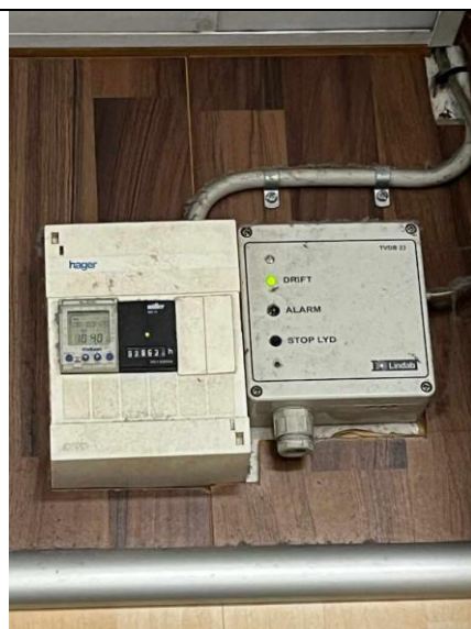
Figur 2: Ventilationstæller aflæst.