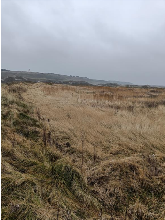
Figur 5.: Billede taget fra sydlige områdes nordlige dige mod syd.