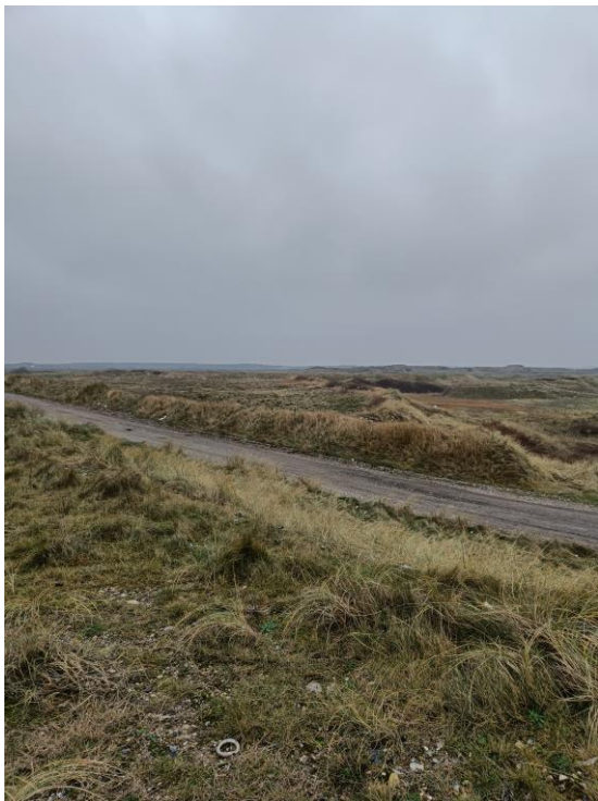
Figur 4.: Billedet viser på modsat side af vejen det nordvestlige hjørne af deponiet