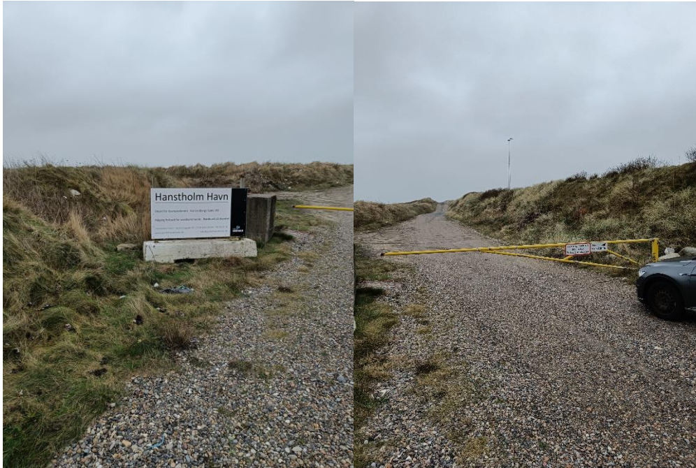
Figur 3.: Billede af deponiets tilgang fra offentlig vej. Til venstre - Skilt med kontaktinformation og adgang forbudt. Til højre - Aflåst bom med adgang forbudt skilt.