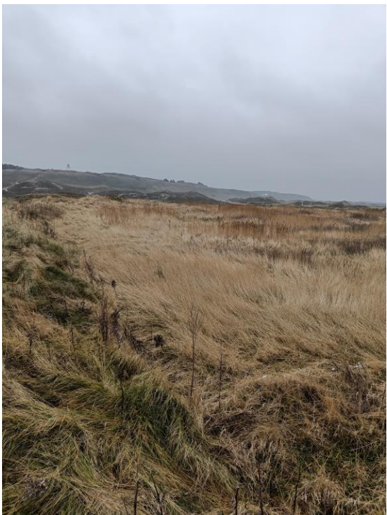
Figur 6.: Billede fra midten af havbundssedimentdepotet set mod øst: diget der adskiller det nordlige (til venstre) og sydlige område (til højre).