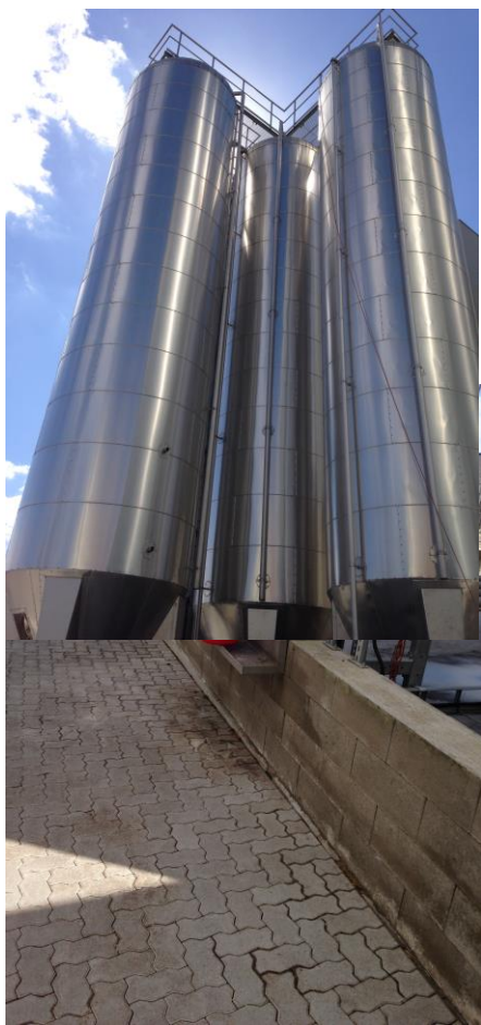
Tanke til flydende råvarer