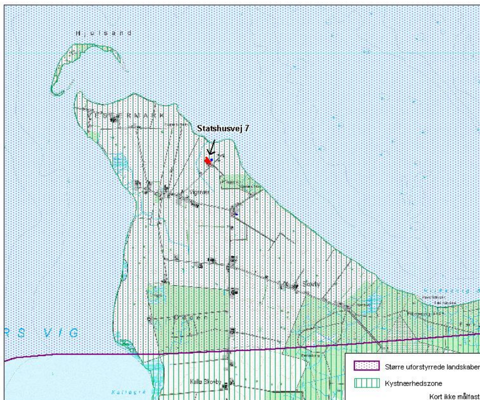
Kort 1. Placering af ejendommen på Statshusvej 7 i forhold til Kystnærhedszone og Større uforstyrrede landskaber.

Derudover er den sydøstligste del af ejendommen, og hvor den nye gyllebeholder skal etableres beliggende indenfor skovbyggelinjen, og de nye stalde og gyllebeholder er beliggende indenfor strandbeskyttelseslinjen.