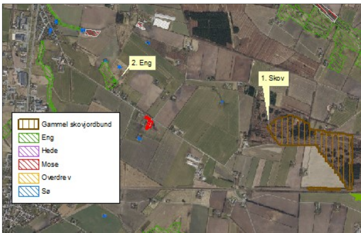
Figur 3. Kort over kategori 3 samt § 3 natur ved anlægget.