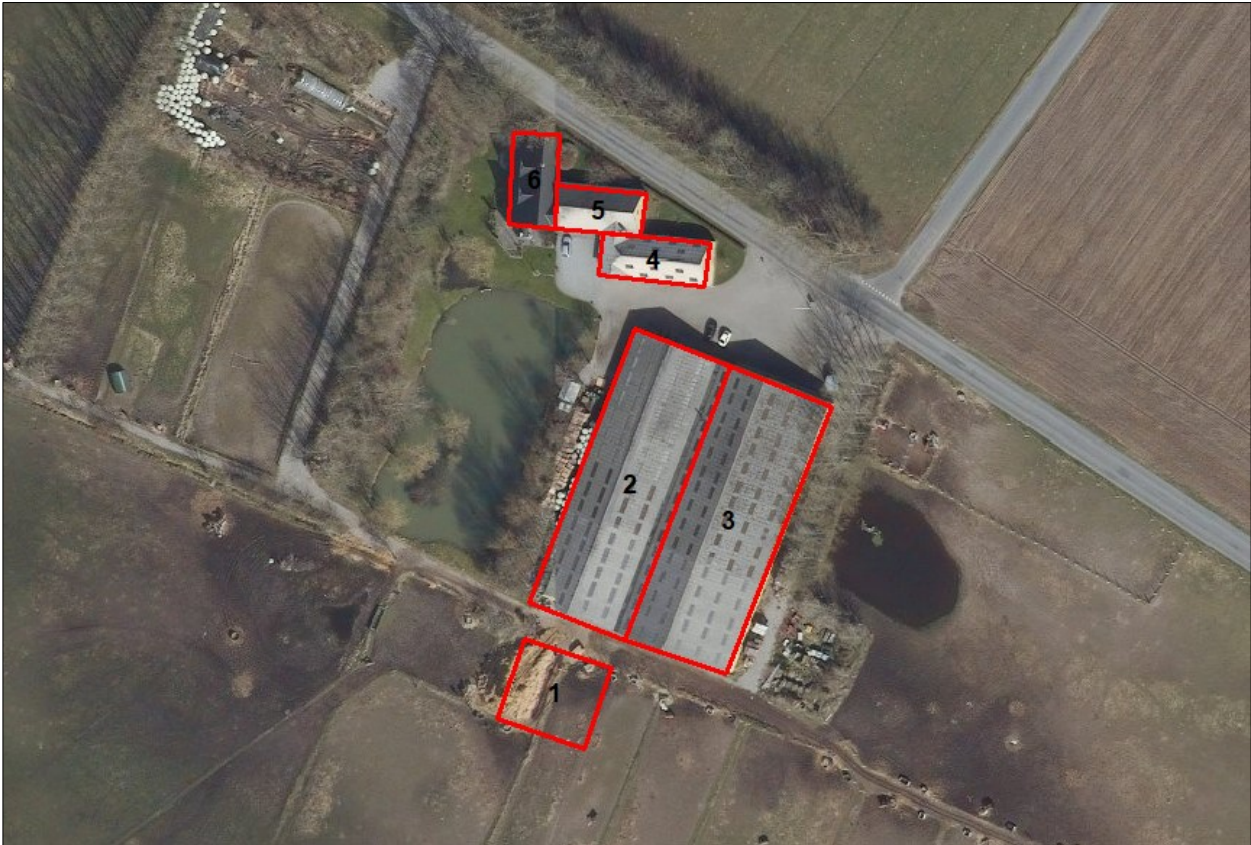
Figur 1. Husdyrbrugets driftsbygninger.