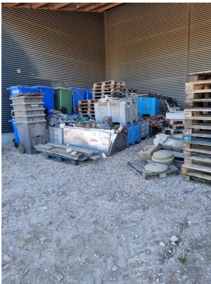
Opbevaring af elektronikaffald

På tilsynet kunne det konstateres, at elektronikaffald nu opbevares under tag, så det ikke kan regne på affaldet.