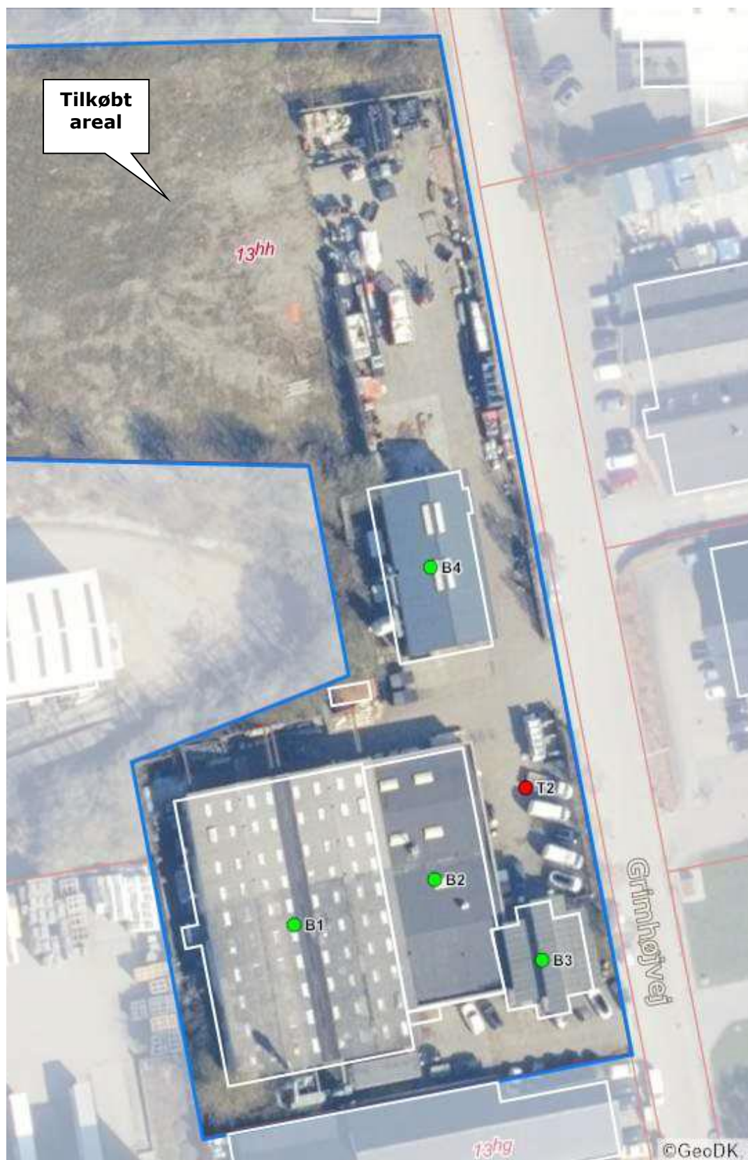
Luftfoto af virksomhedens beliggenhed med matrikelskel fra BBR

Virksomheden ligger i erhvervsområde 240504ER jf. kommuneplanen.