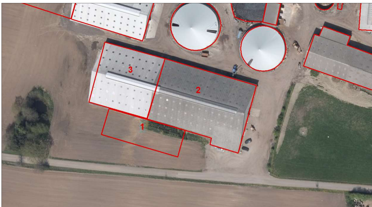
Figur 1. Placering af velfærdsstalden i forhold til eksisterende stald.