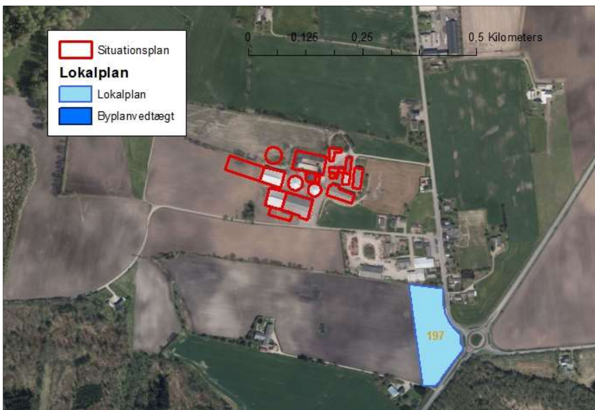
Figur 2. Husdyrbrugets placering.

Husdyrgodkendelseslovens § 20 siger, at kommunen skal sikre sig, at risikoen for forurening eller væsentlige gener begrænses, hvis ændring af anlægget på husdyrbruget foretages indenfor 300 m fra: