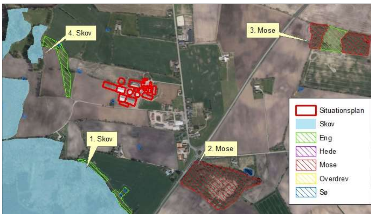
Figur 3. Kort over kategori 3 natur ved anlægget.

Naturtyperne er vist i nedenstående figur og tabel.