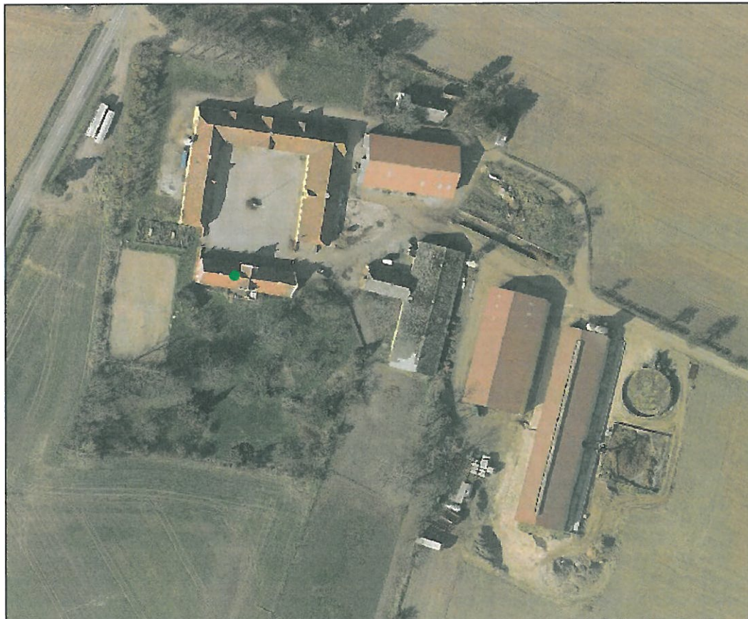
Figur 1: Ejendommen Helnæsvej 15, 5631 Ebberup.