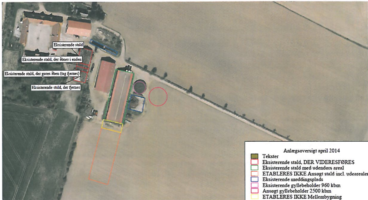
Figur 2. Anlægsoversigt for Helnæsvej 15, 5631 Ebberup.

Slagtesvineproduktionen foregår fortsat efter konceptet for produktion af frilandsgrise. Det betyder, at staldanlægget skal indrettes således, at grisene gives adgang til et udeareal. Svineproduktionen foregår i staldsektioner indrettet med dybstrøelse og opdelt lejeareal og i staldsektioner med delvis spaltegulv, hvor 25-49 % af gulvarealet er fast gulv. Gyllen opbevares i eksisterende gylletank på 960 m 3 , samt i tidligere ansøgte gyllebeholder på 2.500 m 3 på Helnæsvej 15, 5631 Ebberup (Figur 2). Den faste gødning (dybstrøelse) opbevares på møddingspladsen.