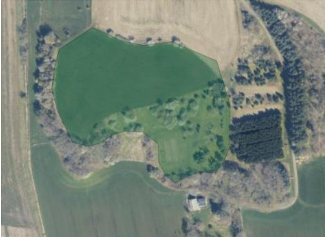
Billede 1. Luftfoto 2023. Lossepladsareal er markeret med grønt.