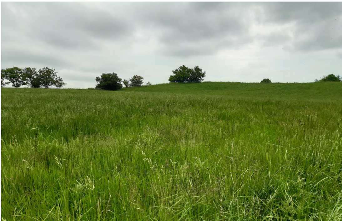
Billede 2. Udsigt ud over lossepladsarealet ovenfor skrænten.