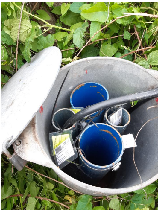
Billede 4. Monitoringsboring FB1, DGU-nr. 108.147.