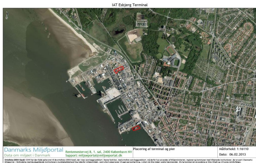
Figur 2 Overbliksbillede af placeringen af tanklageret og havnepier.