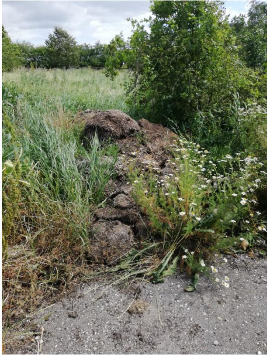
Figur 4: Markmødding uden 5 års rotationsturnus. Uden fast bund eller overdækning