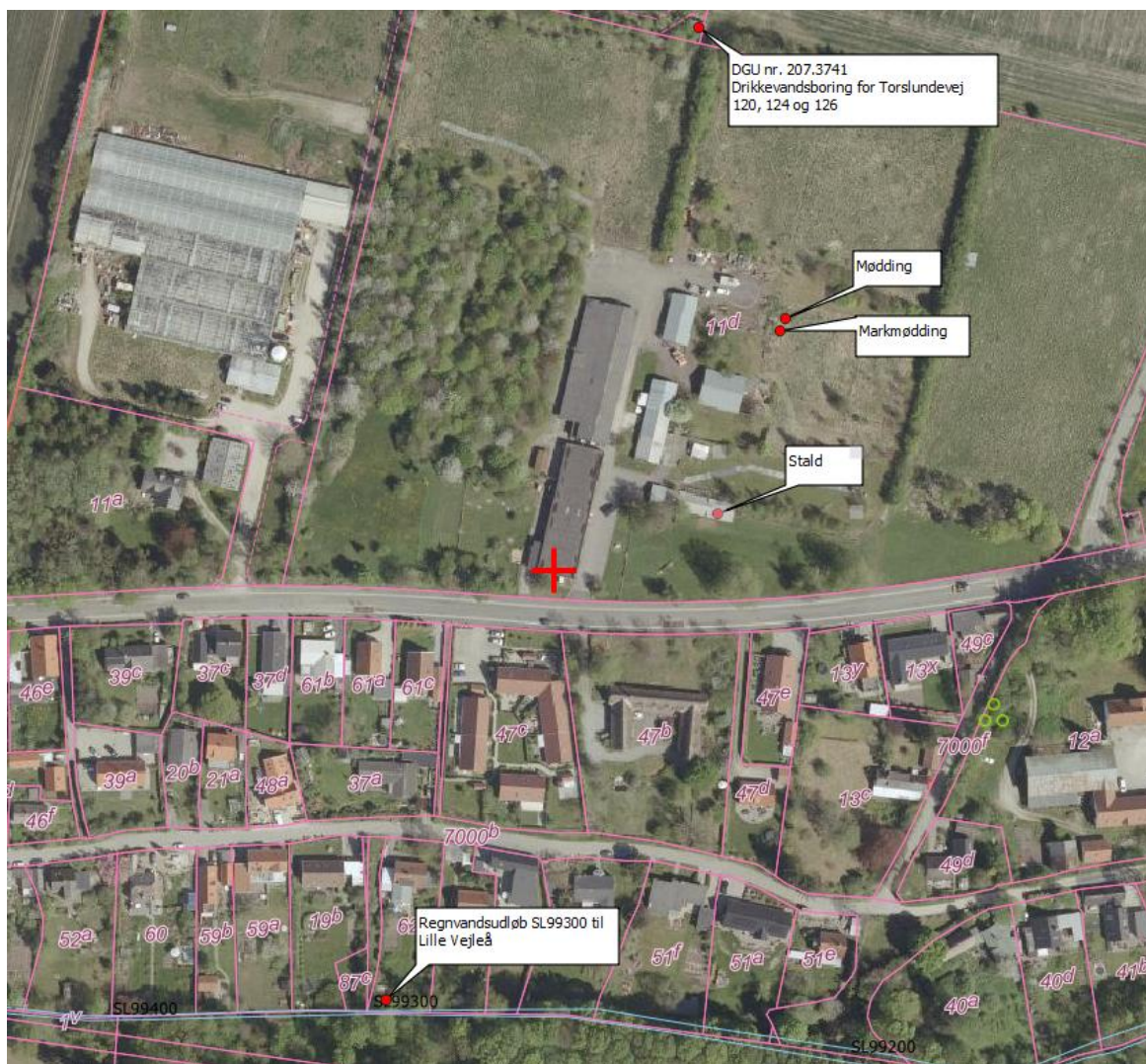
Figur 1: Oversigtkort over tilsyn den 2. juli 2019

Ejendommen har meget lidt affald i forbindelse med hobbyholdet. Eventuelle medicinrester afleveres hos dyrelægen.