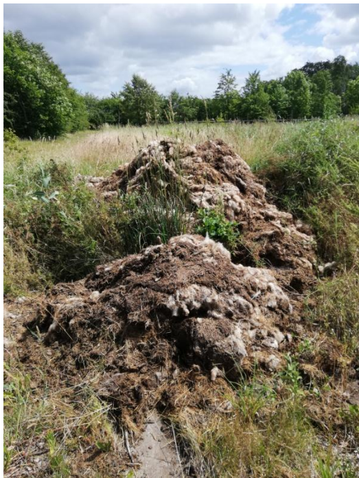
Figur 3: Mødding iblandet fåreuld uden fast bund eller overdækket