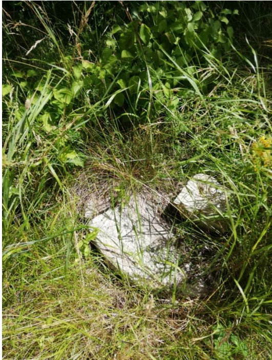
Figur 2: Knækket brønddæksel